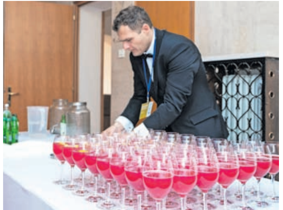
O globalnem razumevanju pitne vode na 9. Blejskem vodnem forumu

Program Blejskega vodnega foruma/festivala bo potekal v skladu z mednarodnimi standardi certifikata odličnosti pitne vode BWF. Standard in certifikat je organizacija