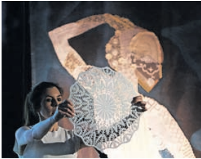
Eva Petrič

New Yorkom. Njeno ustvarjanje je transmedijsko, saj se ukvarja tako s fotografijo, videom in umetniškimi instalacijami kot s performansi, zvokom in literarnim ustvarjanjem. Njena umetnost je bila predstavljena na več kot 100 samostojnih in 140 skupinskih razstavah po vsem svetu. Njena motivacija, da poudari večdimenzionalno arhitekturo prostora, ki jo opredeljuje atmosfera, jo je vodila k uporabi transmedialnega pristopa. Rezultat tega je več kot 30 obsežnih instalacij najdenih in recikliranih čipk, ki so bile razstavljene na različnih, večinoma javnih prostorih po vsem svetu, tudi na Blejskem gradu lani decembra pod naslovom Umetniška vozlišča Eve Petrič.