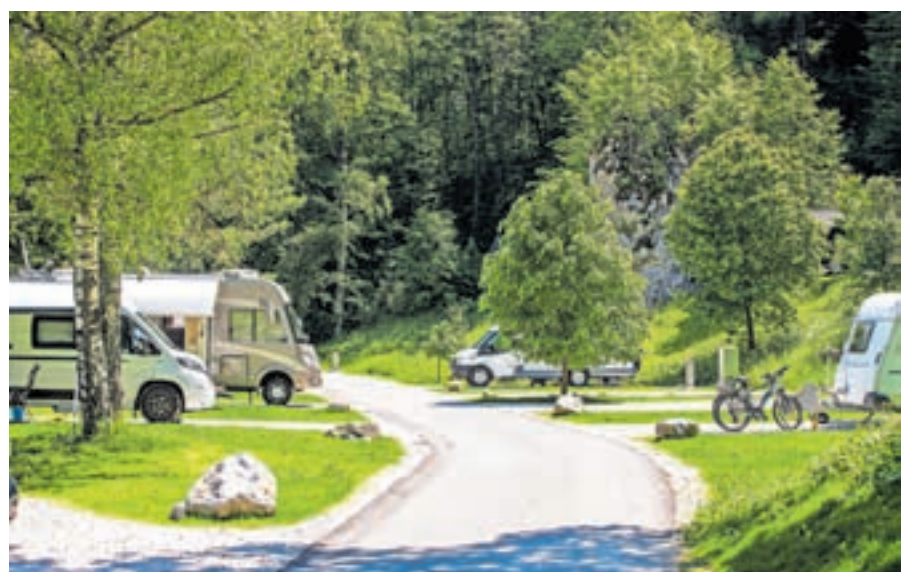
Kamping Bled se je lani pridružil Zeleni shemi slovenskega turizma.

V sanitarnih objektih varčujejo z vodo, na vseh prhah in armaturah so nameščeni perlatorji za zmanjševanje pretoka vode,