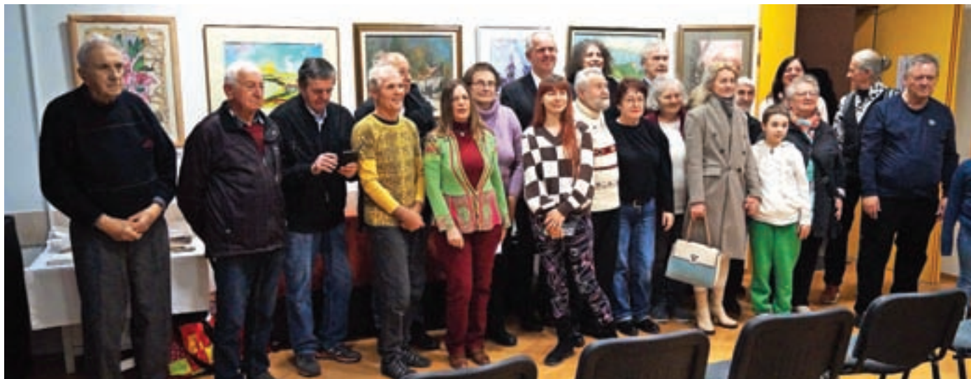
Skupinska slika z razstave Mokrocveteče rož'ce poezije

Kulturno društvo likovnikov Kranj je tudi v letošnjem letu nadaljevalo svojo raznoliko dejavnost, še posebno na likovnem področju.