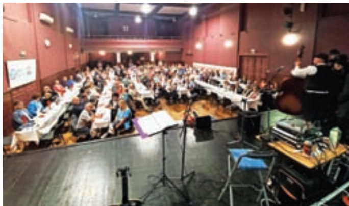
Prijetno druženje v veliki dvorani Doma krajanov na Primskovem

društvo je prostovoljno, neodvisno in samostojno humanitarno združenje. »Načrtujemo, organiziramo in izvajamo programe, ki invalidom omogočajo bolj aktivno življenje, pripomoremo k odstranjevanju ovir in neodvisnemu življenju. Organiziramo in izvajamo dejavnosti za ohranitev zdravja in druge rehabilitacijske programe za delovne invalide ter izvajamo in sodelujemo pri izvajanju in razvijanju posebnih socialnih, zdravstvenih, izobraževalnih, kulturnih in športno-rekreacijskih in drugih programov za invalide. Vse to izvajamo v lastnih prostorih, deloma tudi v najemnih, predvsem za športne aktivnosti,« je povzel Zelnik, ki se je zahvalil tudi prostovoljcem, ki v dobro skupnosti darujejo svoj prosti čas.