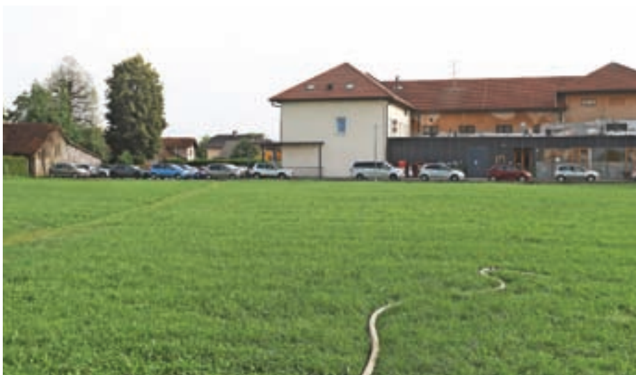
Travnik ob Domu krajanov Primskovo bo občina odkupila za 670 tisoč evrov (z DDV).

stavbnega spremenila v zelene parkovne površine. Leto dni kasneje je sklad na ustavno sodišče vložil pobudo za oceno ustavnosti in zakonitosti občinskega prostorskega akta. Ustavno sodišče je leta 2020 odločilo, da je OPN v tem delu neustaven, in določilo, da mora občina neustavnost odpraviti v enem letu. Ob tem ji je še naložilo, da mora zagotoviti skrbno tehtanje javnega in zasebnega interesa pri določitvi namenske rabe zemljišč ter presoditi, ali obstaja razumno razmerje sorazmernosti med koristmi, ki jih ukrep zasleduje, in pri-