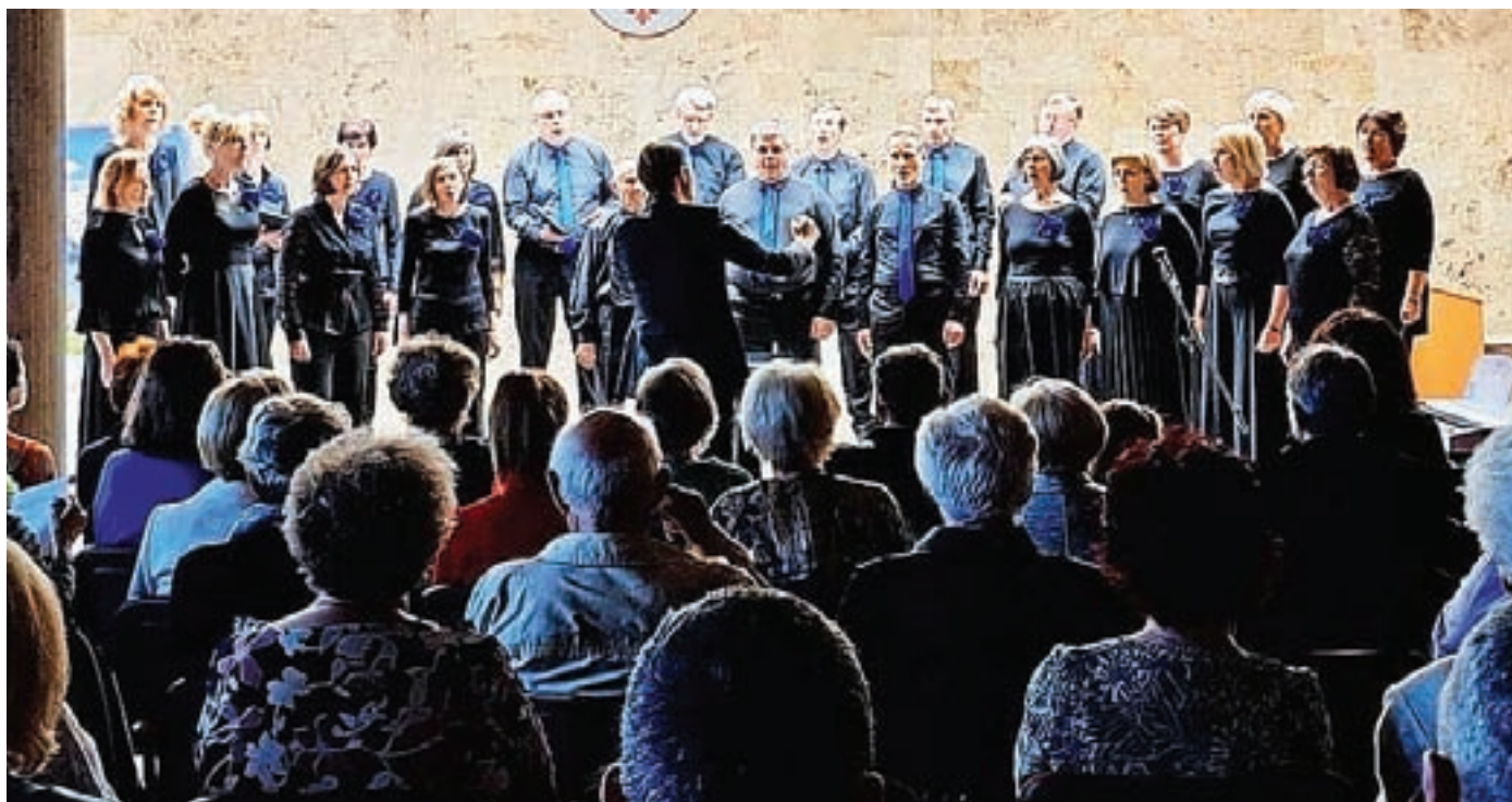
Ob intenzivnem delu je zbor spomladi pripravil dva koncerta