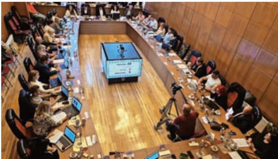
Mestni svet je soglasje za sklenitev sodne poravnave podal na majski seji.

Spor med občino in sklado glede zemljišča, na katerem je sklad načrtoval večstanovanjsko gradnjo, krajanji pa si želijo ohraniti zelene površine oziroma ureditev parka, se vleče že vse od leta 2014, ko je občina na pobudo civilne iniciative in Krajevne skupnosti Primskovo z novim občinskim prostorskim načrtom (OPN) namembnost zemljišča iz