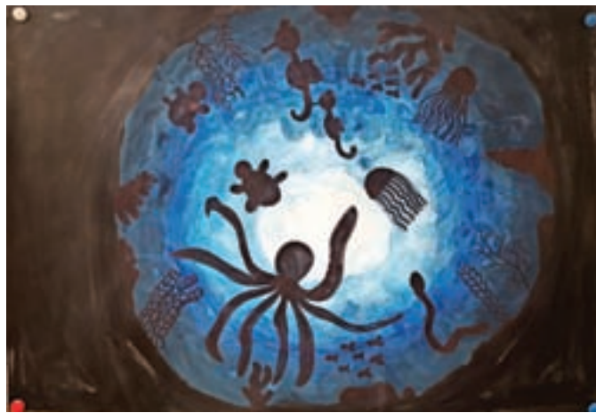
Morje, Ema, 5. e