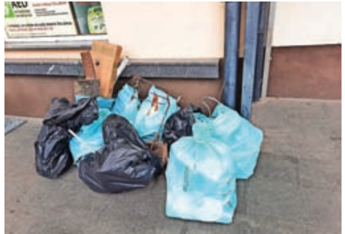
Najlepše bo, ko bo ozaveščenost o čistem okolju tako visoka, da čistilne akcije sploh ne bodo več potrebne.

nikov občine Kranj, Mestne občine Kranj in Komunale Kranj. Sodelovali so člani Sveta KS Primskovo, ki se zahvaljujejo tudi domačim gasilcem in krajanom za udeležbo in sodelovanje na akciji. Z njo so sicer na prvi dan začeli učenci kranjskih osnovnih šol, otroci nekaterih vrtcev in dijaki srednjih šol, ki so poskrbeli predvsem za čistočo svoje bližnje okolice.