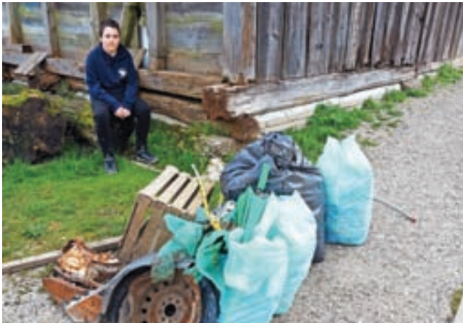
V čistilni akciji so sodelovali tudi mladi, na sliki z zbranimi odpadki pred Kokro.

V tradicionalni čistilni akciji Očistimo Kranj 2024 – Kranj ni več usran je okoli 6300 Kranjčanov iz urbanega in naravnega okolja odstranilo skoraj osemnajst ton različnih odpadkov. Akcija je potekala 22. in 23. marca v organizaciji Zveze tabor-