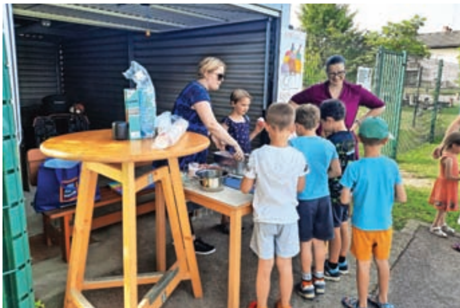
Osvežilni sladoled na prireditvi Veselo na počitnice

Na dogodku smo tudi »lovili« srečo. S pomočjo različnih sponzorjev smo pripravili srečelov in srečo delili med obiskovalce. Poskrbljeno je bilo za hrano, pijačo in najboljšo poletno osvežitev – sladoled, tudi ta je bil podarjen. Vzdušje na šolskem igrišču je bilo zelo veselo,