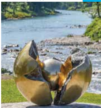
Krogla z jedrom