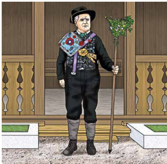
Upodobitev Jakoba Aljaža v animiranem filmu