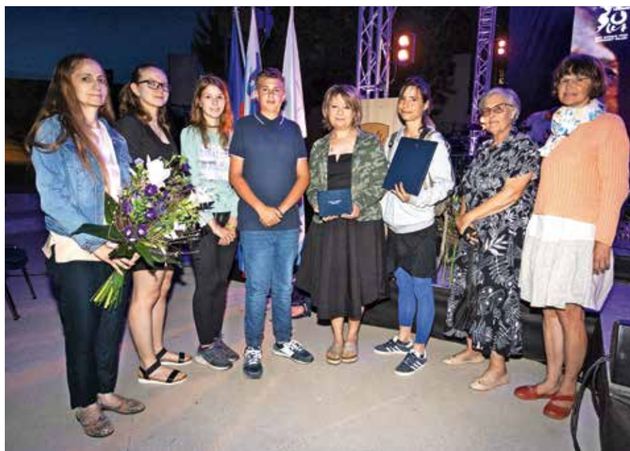
Člani Društva za varovanje okolja in pomoč živalim v stiski Reks in Mila

Člani društva že skoraj deset let z neizmerno požrtvovalnostjo, vztrajnostjo, pogumom in kljub premnogim preprekam ostajajo glas živali ter varuhi naravnega okolja in ohranjanja biotopov. Kljub majhnemu številu prostovoljcev in veliko stroškom vztrajajo, ne odnehajo. S trdim delom si ob redni službi vsak dan ob večerih po več ur na terenu prizadevajo v povezovanju in sodelovanju z različnimi vladnimi in