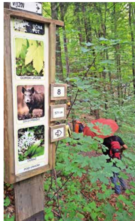
Oznake in zanimive informacije na poti roparskih viteзов

vanju 30-letnice Občine Medvode,« spomni predsednica društva Zvonika Hočevvar in nadaljuje: »Mimo dveh kmetij se nato pot povzpne do mežnarije in cerkve sv. Marjete, kjer pohodnike pričakajo svečano oblečene dame roparskih vi-