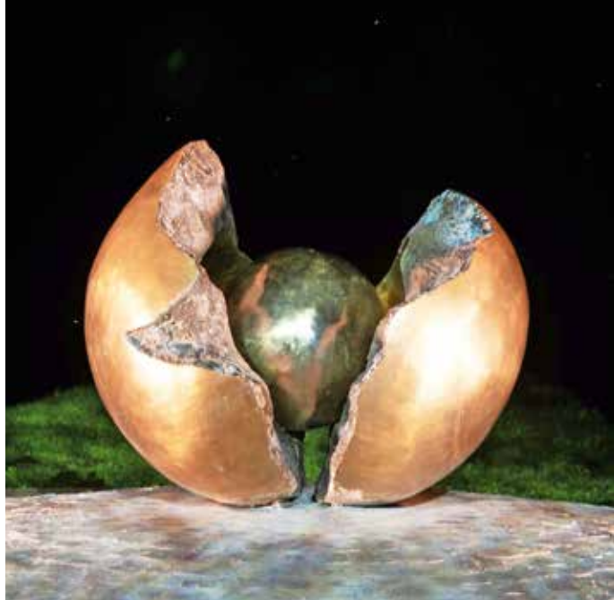
Krogla z jedrom v večernem soju luči