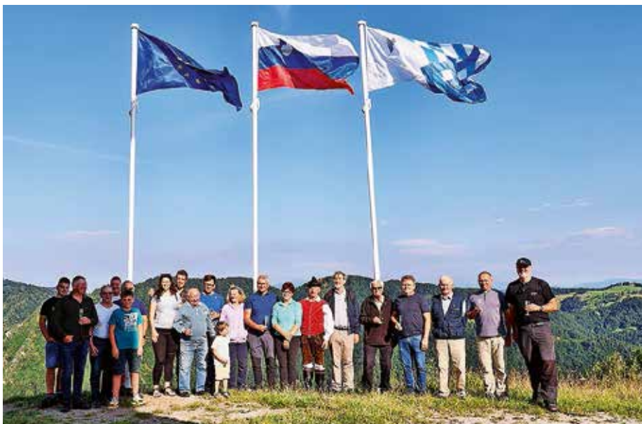
Ob slovesnem dvigu in blagoslovu zastav na Sv. Jakobu na rojstni dan občinskega zavetnika Jakoba Aljaža

tezov ter jim postrežejo dobrote vaških gospodinj, bezgov sok in kapljico domačega. Tu si popotnik lahko oddahne ob zmajevi mizi, kjer je tudi tabla z legendo o marješkem zmaju. V prehodu med cerkveno ladjo in zvonikom je na desni, na steni zvonika, pritrjen ekran, na katerem se lahko seznanite z zanimivostmi iz zgodovine in življenja v teh krajih. Sto metrov naprej, v smeri Jeterbenka, stoji informativna točka z opisom arheoloških raziskav Kašče. Ob tabli je vitez, ki mu za nekaj trenutkov lahko posodite svoj obraz, poleg pa je 'kaščogled', ki vam pokaže lokacijo vzpetine Kašča. Nadaljujete po gozdni poti po južnem pobočju pod grebenom, na katerem je nekoč stala utrdba viteзов Jeterben-