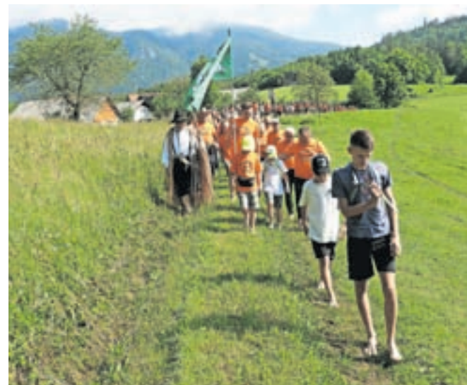
Pohoda se je udeležilo 125 bosonogih.

ko drevja, tako da so imeli organizatorji zelo veliko dela, da so pot na vrh Vovar-