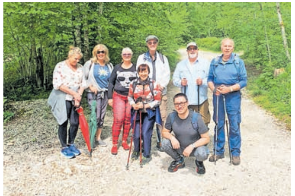
Spominski pohod v Kamniško Belo