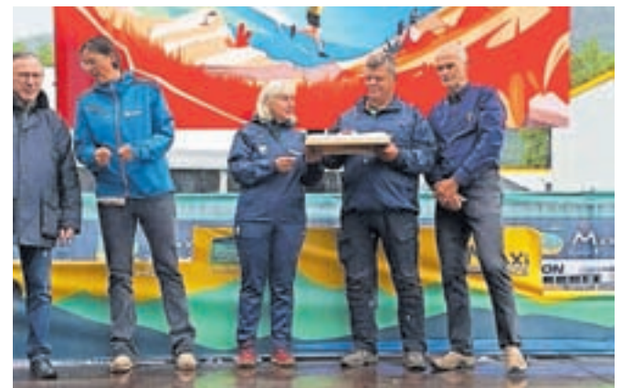
KGT Papež je ponosni organizator evropskega prvenstva v gorskih tekih in trailu / FOTO: ARHIV KGT PAPEŽ