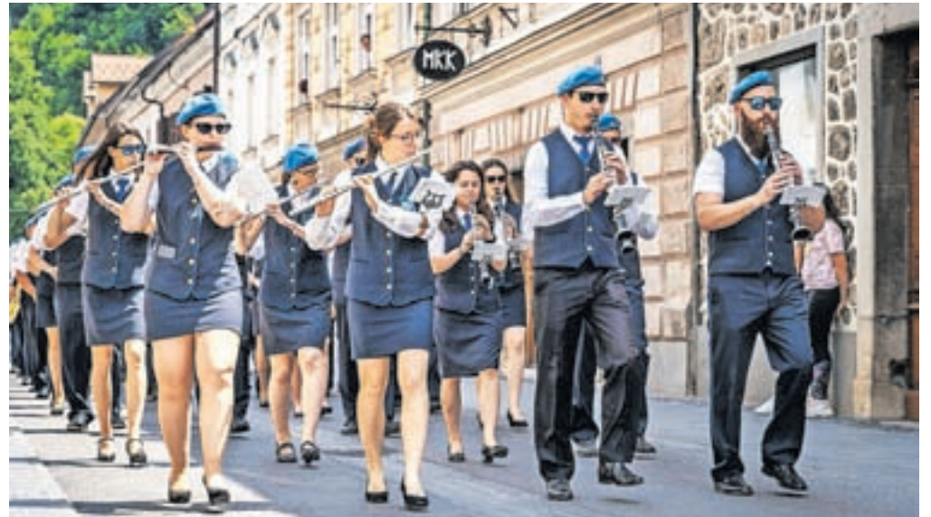
Godbeniki Mestne godbe Kamnik

Program mestne dobe pa je bil tematsko obarvan. Izvedli so svetovne plese paso doble, valček, bossa nova, rumba, sirtaki, tango, samba, gopak in polka. Obiskovalci, ki se jih je ob lepem vremenu zbralo precej, so tako lahko prisluhnili Valčku št. 2 Dmitrija Šostakoviča, Libertangu Astorja Piazzolle,