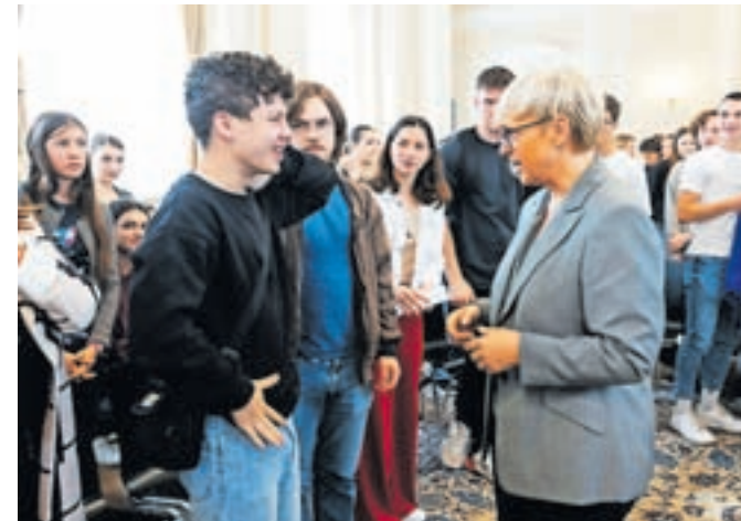
Dijaki v pogovoru s predsednico Natašo Pirc Musar

Ljubljana – V sredo, 29. maja, se je skoraj 120 kamniških gimnazijek in gimnazijcev odpravilo na ekskurzijo v Ljubljano, ki je potekala v okviru obveznih izbirnih vsebin ter aktivnega državljanstva. Slednje je predmet, pri katerem dijaki med drugim spoznavajo tudi delovanje države ter njenih institucij, zato smo se letos odločili za ogled in spoznavanje Predsedniške palače. Vrh obiska je predstavljal sprejem in pogovor s predsednico republike, Natašo Pirc Musar.