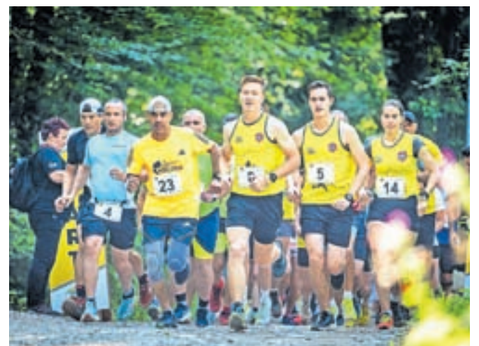
Tečem, da pomagam

Pomemben dogodek, ki so ga obudili prvič po preteku obdobja epidemije covid-19, pa je dobrodelni tek Tečem, da pomagam, ki je veljal tudi kot eden od tekov Tekoškega pokala Občine Kamnik. Start je bil pri Športnem parku Podgorje, nato je potekal po gozdni cesti do obračališča Pr' Jeršin in spet nazaj. Mlajše kategorije pa so se podale