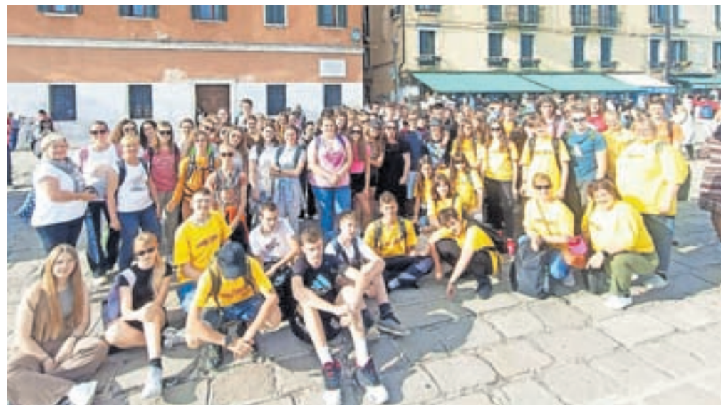
Učenci na izletu v Benetkah

Rialto. Tudi tukaj smo imeli učenci ponovno čas za raziskovanje mesta in njegovih skrivnih kotičkov ter preizkušanja italijanskega sladoleda. Okoli 18. ure se je naše raziskovanje Benetk zaključilo. Z ladjico smo se vrnili do avtobusa in začela se je naša 4-urna pot domov. Med vračanjem je kljub utrujenosti na našem avtobusu zavladalo pravo vzdušje, polno smeha, petja in dobre volje. V Kamnik smo se vrnili okoli 23. ure zvečer. Obisk Italije nam bo za vedno ostal v lepem in nepozabnem spominu. Zagotovo pa to ni bil zadnji obisk Benetk in otoka Burano, marsikdo izmed nas ga bo še obiskal. V imenu vseh učencev občine Kamnik, ki smo opravili bralno značko vseh 9 let, se najlepše zahvaljujemo vsem