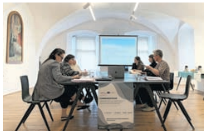
Projekt Commheritour sofinancirata Evropska unija iz programa Interreg Danube Region in Občina Kamnik.

Po triurni razpravi na prvi delavnici so se deležniki strinjali, da je eden ključnih problemov vrednotenja kulturne dediščine pomanjka-