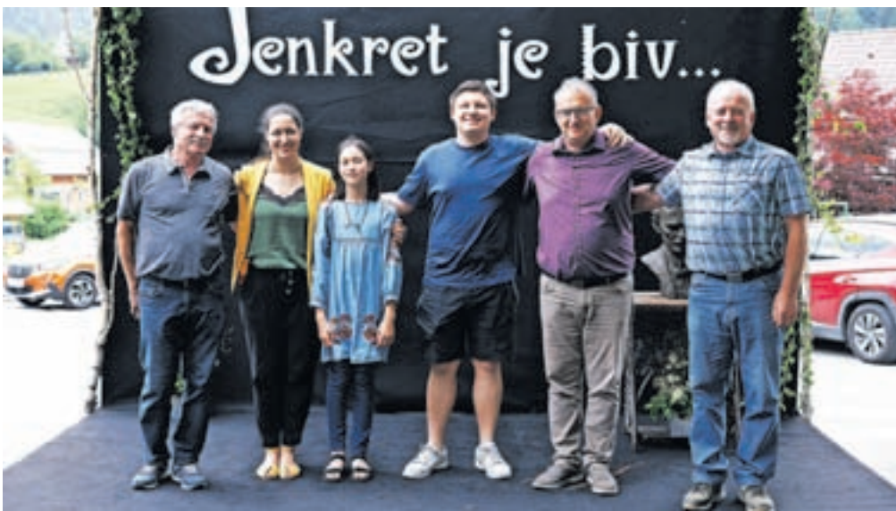
Medgeneracijska motniška pripovedovalska skupina