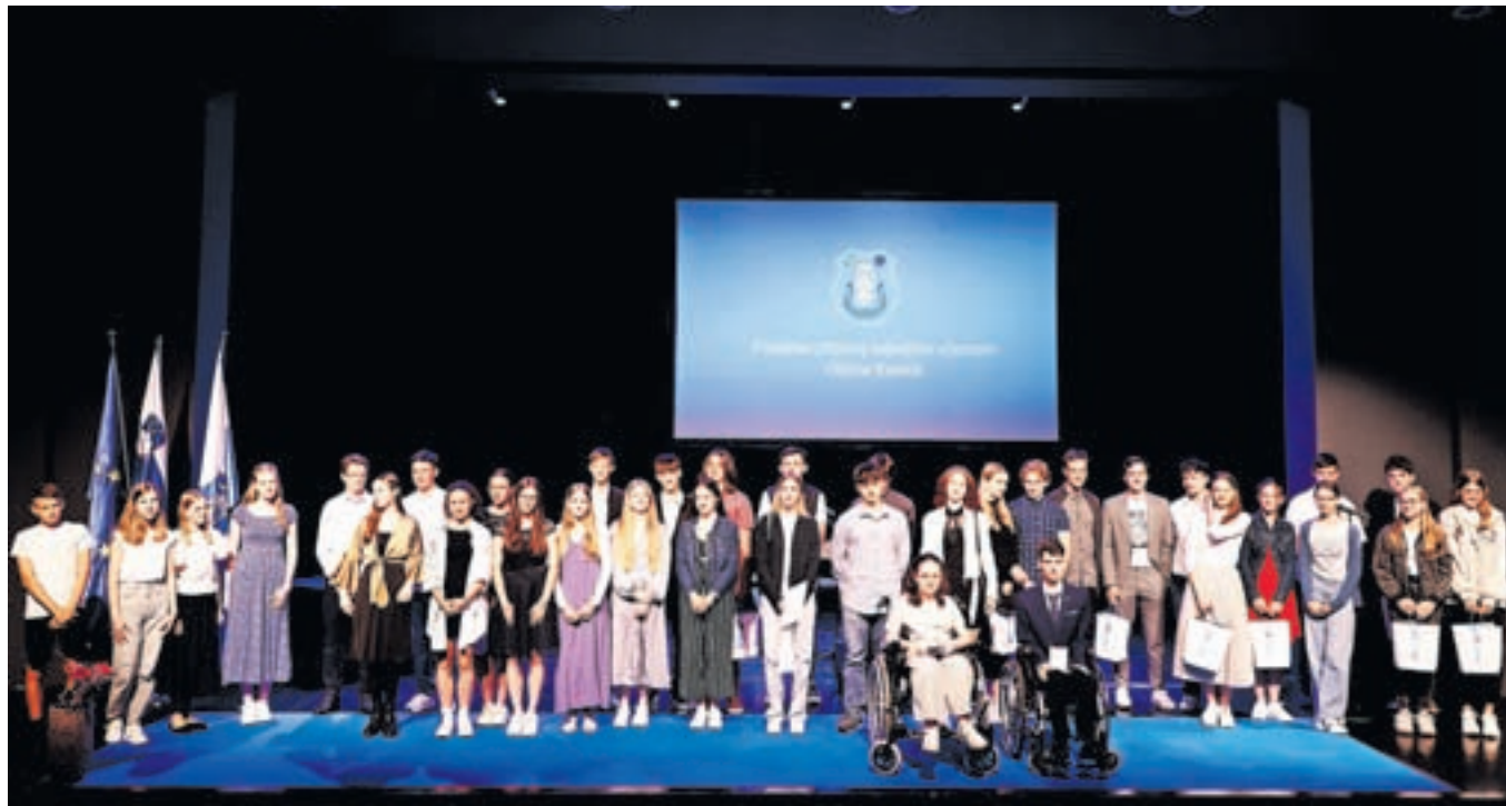
Letošnji najboljši učenci in dijaki kamniških osnovnih in srednjih šol ter glasbene šole

Župan Matej Slapar je ob koncu šolskega leta v Domu kulture Kamnik podelil priznanja in knjižne nagrade 37 najboljšim učencem in dijakom kamniških osnovnih in srednjih šol ter glasbene šole.