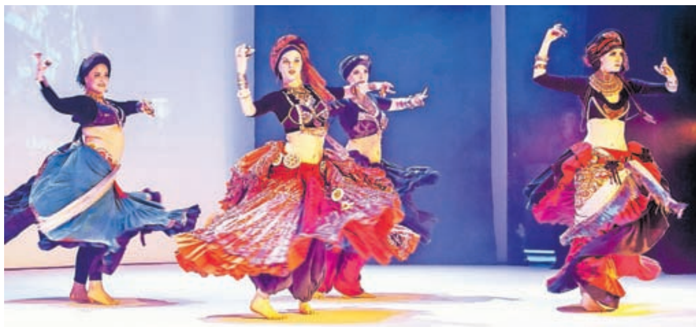
Prava paša za oči so bili poleg plesa tudi kostumi nastopajočih.

ki so vplivale na izoblikovanje značilnih plesnih gibov, klasično rutino, v kateri so plesalke lahko predstavile vse svoje znanje, ter moderne stile, na katere imajo velik vpliv tudi družbena omrežja. Na zahodu se je Sloveniji in tujini, letne produkcije plesne šole, uprizorile so deset plesnih predstav, od katerih so najbolj ponosne na predstavo Hamsa – 5 elementov orientalskega plesa iz leta 2015. Letošnjo obletnico bodo no-