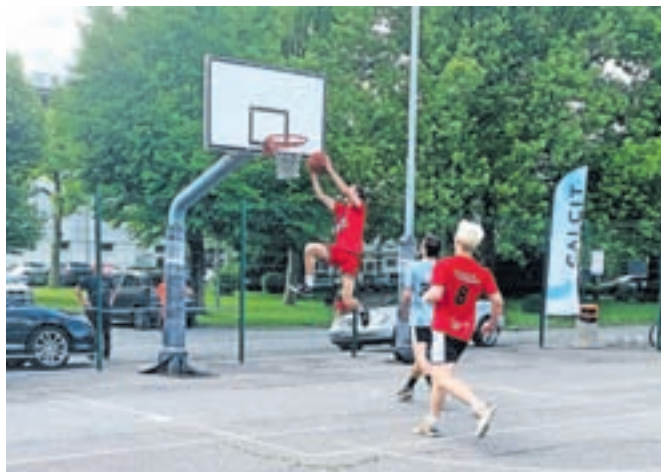
Udeleženci Košarkarskega maratona so poskrbeli tudi za zanimive poteze.

Duplica – Košarkarje združene pod imenom Duplica in ostali so premagali z 647:680. Tako so se člani Košarkarskega kluba Kamnik domačinom oddolžili za lanski tesen poraz in si zagotovili, da se je pokal vrnil v vitrine edinega organiziranega košarkarskega kluba v Kamniku. Napeta tekma in atraktivne poteze vseh igralcev so dokaz, da se v Kamniku igra dobra košarka in da si Calcit Basketball zasluži podporo na tekmah v prihodnji košarkarski sezoni.