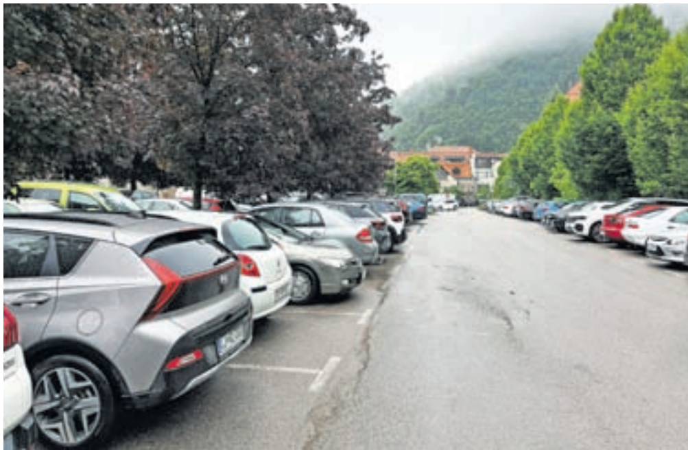
V Kamniku bo jeseni zaživel nov režim parkiranja.