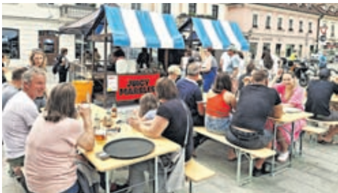
Tako kot na prvi bodo tudi na tretji tekmi nogometne reprezentance navijači lahko okušali dobrote tekmovalcev MasterChefa.

Nato se bo kulinarično dogajanje preselilo na tradicionalno lokacijo v Park Evropa. V petek, 5. julija, bosta za glasbeno spremljavo poskrbeli skupini Smetnaki in Majmunska posla. V petek, 12. julija, bo zaigrala glasbena zasedba Ar'n'Bi. Avgustovska KUL petka bosta minila z nastopom Ane Papedan 9. avgusta in glasbene skupine Mat na kvadrat 16. avgusta. Vselej bo seveda na voljo tudi pestra kulinarična ponudba lokalnih in drugih gostinskih ponudnikov.