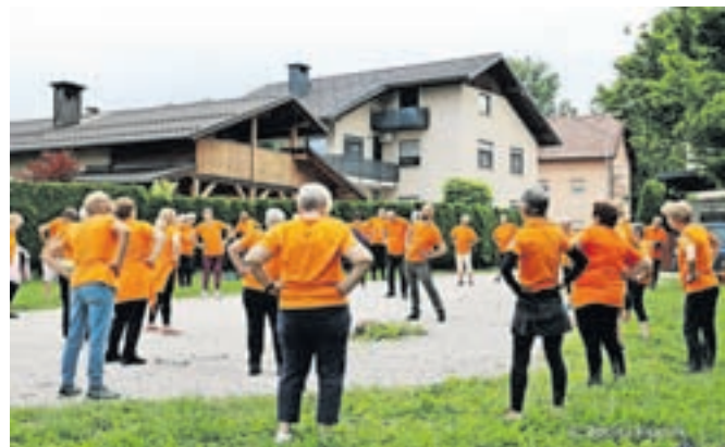
V Keršmančevem parku vadijo že 15 let.

V Sloveniji deluje več kot 250 skupin z več kot pet tisoč člani, ki vsako jutro telovadijo od pol osmih do osmih.