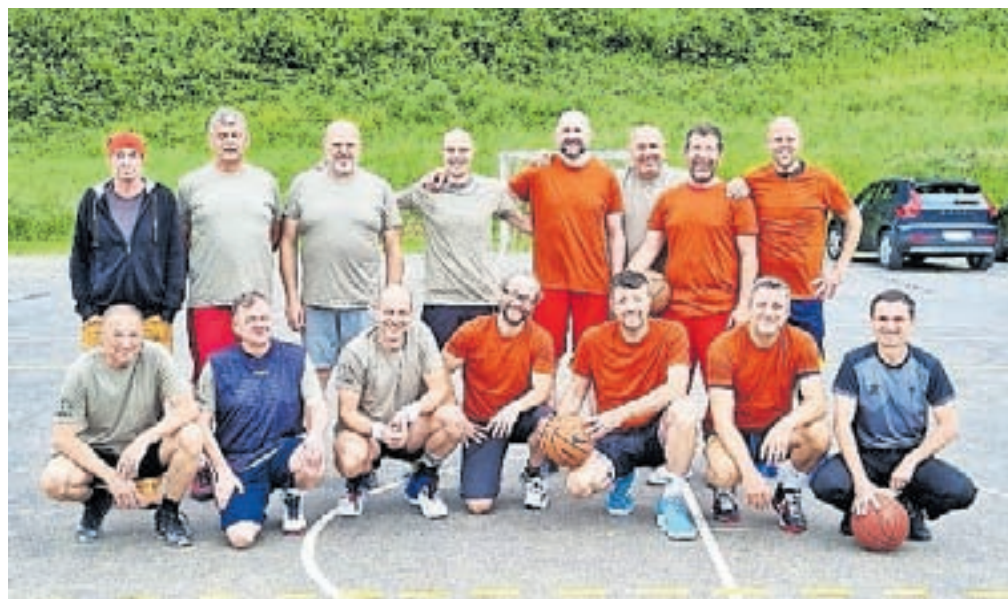
Veterani so se znova pomerili