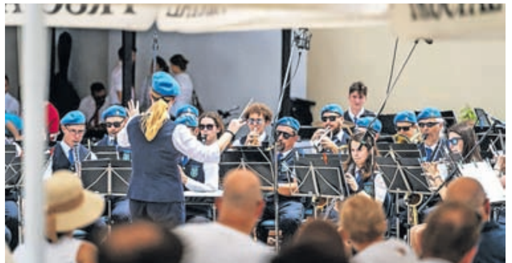
Glavni trg je bil godbeno obarvan.

Avsenikovi Na svidenje, skladbi Zorba the Greek Mikisa Theodorakisa in drugim znanim melodijam svetovne glasbene zakladnice.