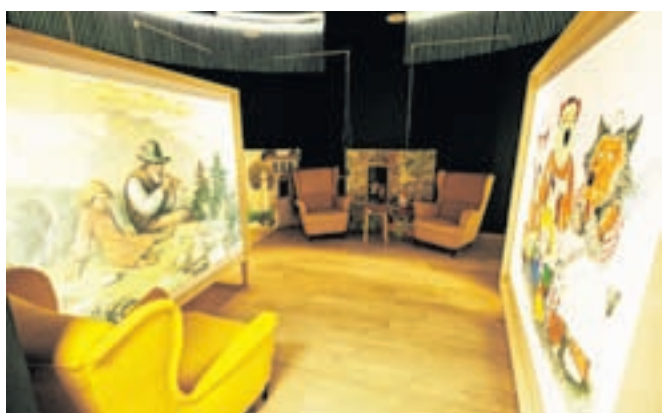
Stalna razstava o slovenskem pripovednem izročilu skozi čas v motniški Pravljirni hiši