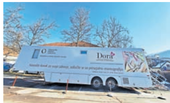
Mobilna enota programa Dora, kjer poteka slikanje žensk, se bo v Kamnik vrnila čez dve leti.

Kot so pojasnili na Onkološkem inštitutu Ljubljana, je rak dojke še vedno najpogostejši rak pri ženskah. Okoli 1.500 jih vsako leto na novo zboli, približno 80 odstotkov vseh zbolelih pa je starejših od 50 let. »S presejalno mamografijo, ki je s strokovnimi raziskavami dokazano najbolj varna in učinkovita metoda za odkrivanje zgodnjih raka-vih sprememb v dojki, lahko v programu Dora odkrijejo bolezenske spremembe, ki jih ženska sama še ne more zaznati,« so pojasnili, ob tem pa dodali, da zgodaj odkrit rak dojke praviloma pomeni večjo verjetnost ozdravitve, samo zdravljenje pa je manj obsežno, kar lahko vpliva na kakovost življenja bolnic z rakom dojke. V programu Dora zato ženskam svetujejo, da se redno udeležijo preventivne mamografije.