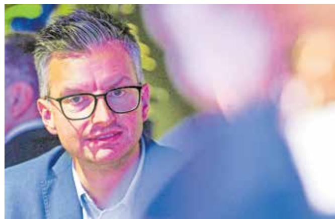
Marjan Šarec (Gibanje Svoboda) z izvolitvijo v Evropski parlament zapuša položaj ministra za obrambo.