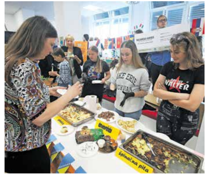
Na OŠ Simona Jenka so se seznanili z balkansko kuhinjo.