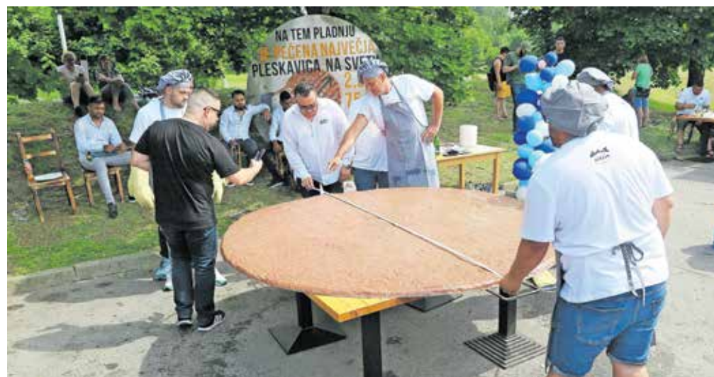
Še surova je imela premer 225 centimetrov.

Zaigrali so »trubači«, zaplesali mladi folklorniki iz srbskega kulturnega društva SKD Prosvjeta Pododbor Vojnić. Predstavili so se s plesi in igrami iz