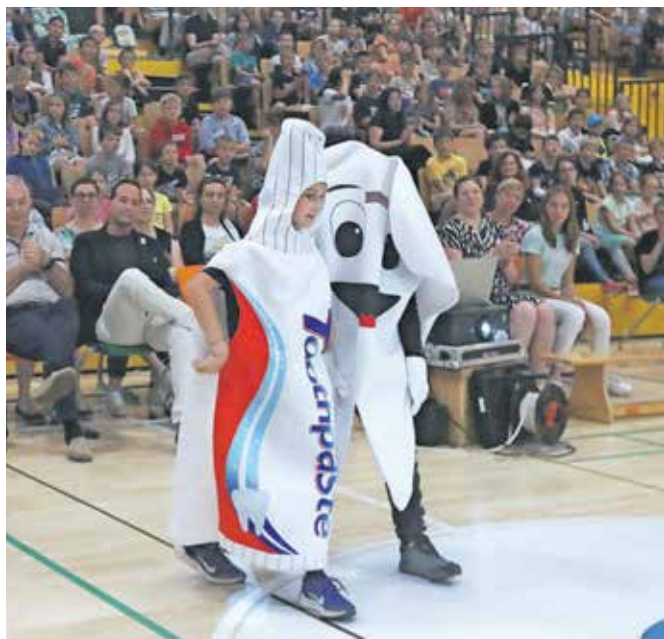
Maskoti akcije Čisti zobki