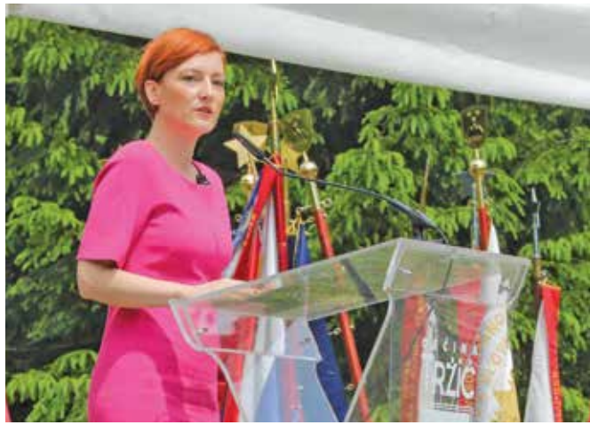
Ministrica za kulturo Asta Vrečko je bila osrednja govornica slovesnosti.