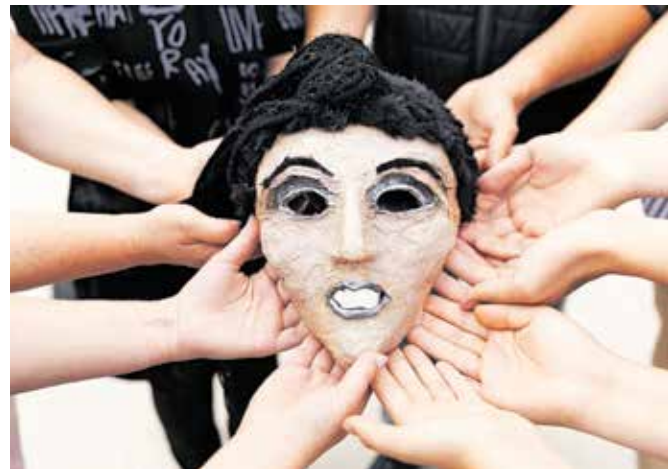
Po Kralju Ojdiu v Medvodah še Antigona / Foto: Peter Košenina

Premiera bo 4. junija ob 21. uri, ponovitve pa bodo v soboto in nedeljo in še naslednji konec tedna, 21., 22. in 23. junija. V primeru dežja je rezervni zadnji konec tedna v juniju. Vstopnice je moč rezervirati na elektronskem naslovu zmgedalisce@gmail.com in jih prevzeti na prizorišču uro pred predstavo.