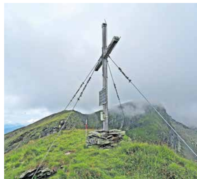
Z vrha Stoder se proti zahodu lepo pokazeta vrh Gmeinecka in grebenska pot.