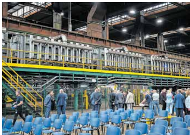
Prenova linije CRNO je za SIJ Acroni strateško pomembna naložba.

zahtevalo naložbe, ki bi po prvih ocenah presegle 100 milijonov evrov. SIJ Acroni je pomemben član misije GREen MObility (GREMO) in z vlaganji v proizvodne zmogljivosti ter razvoj tehnologij prispeva k utrjevanju položaja slovenske avtomobilske industrije kot enega izmed evropskih centrov za razvoj zelene in trajnostne mobilnosti.