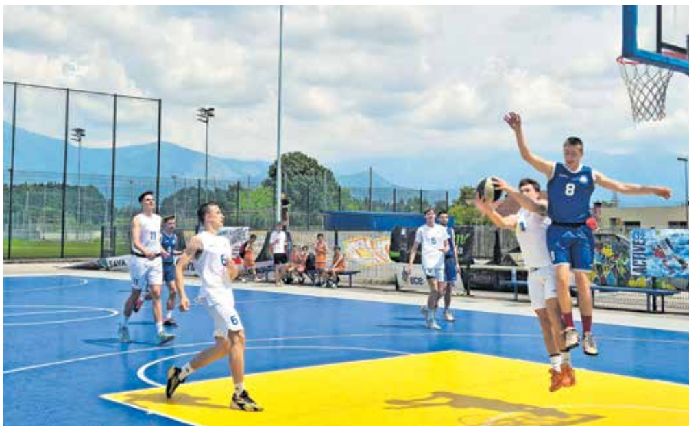
Dan Košarkarskega kluba Triglav je minil v znamenju igranja košarke mlajših in starejših selekcij.