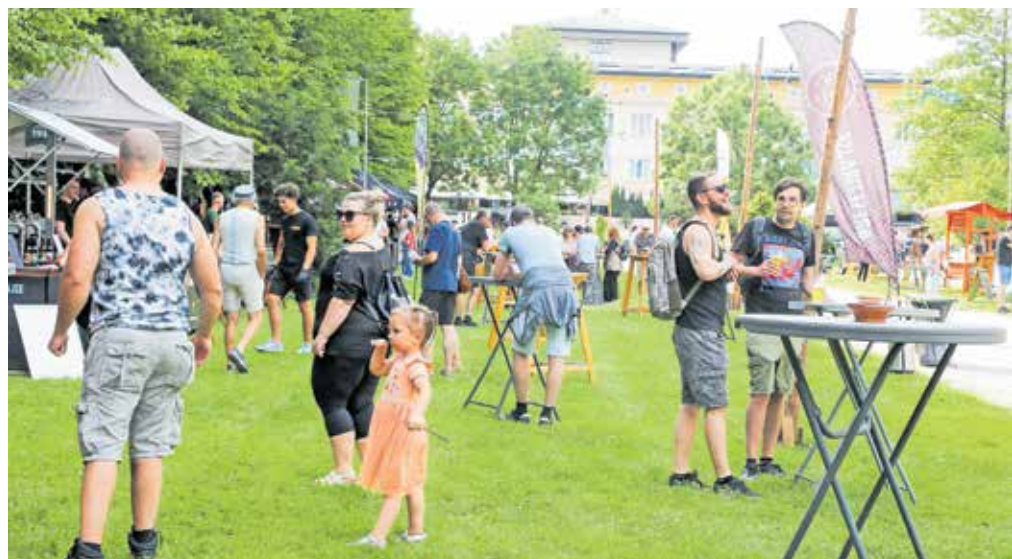
Mnogi so v Radovljico prišli uživat v najljubših okusih piva ter dobri glasbi.

Tokrat Škofja Loka gosti Dneve piva in kulinarike. Organizatorji so si zadali izziv in se povezali s škofjeloškimi gostinci, ti pa bodo vse do 23. junija v svojih gostilnah in barih ponujali jedi in pijače,