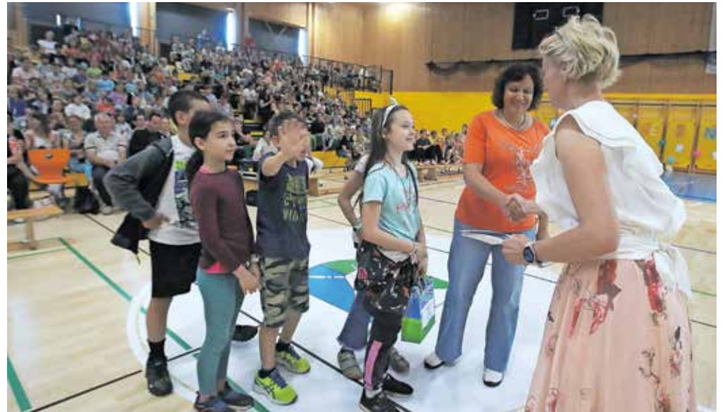
Učence, ki so si vse leto najbolj pridno umivali zobe, so tudi nagradili.