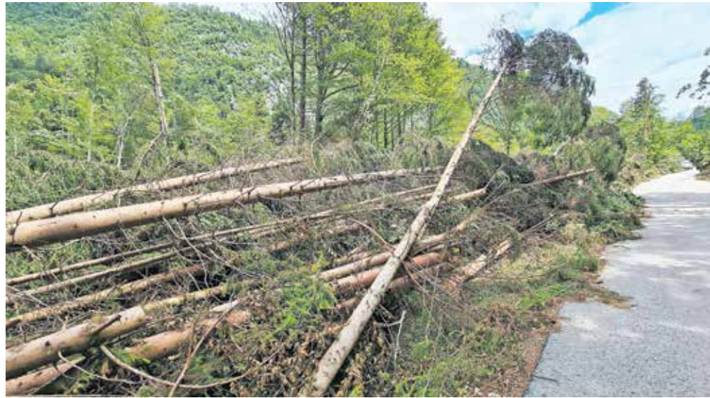
Tako je bilo julija lani v dolini Radovne ...

V zavodu za gozdove se bojijo novih vetrolomov, saj vsak vetrolom ustvarja pogoje za nove ujme in za nova žarišča lubadarja.