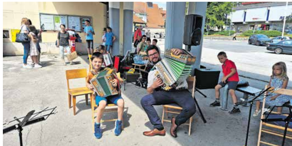
Na avtobusni postaji so se predstavili učenci diatonične harmonike.