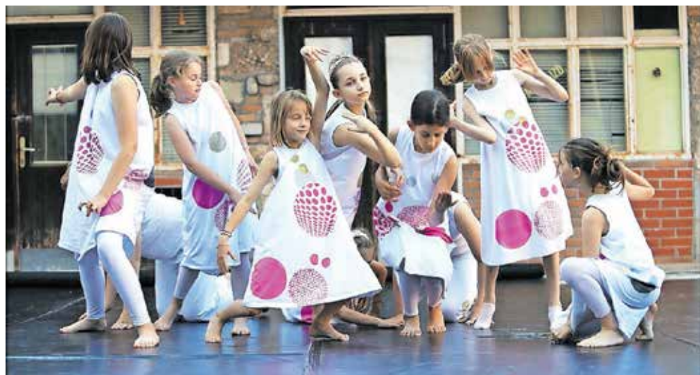
V plesni točki skupine KIČE z naslovom Če bi... bi-bi so plesalci eksperimentirali in komunicirali tako z gibalnim kot zvočnim materialom.