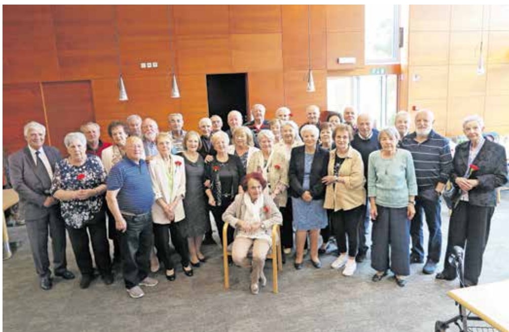
Šestdeseta obletnica mature na TTŠ Kranj (1964–2024)

Na tokratnem srečanju so se dobili učenci takratnih četrtnih letnikov. Prišlo jih je 32, med njimi deset iz predilnega razreda, šest tkalcev, sedem iz pletilskega in devet iz apreterskega. »Imeli smo sošolce iz Krapine, Podgorice, Beograda, Bihaća, Tetova