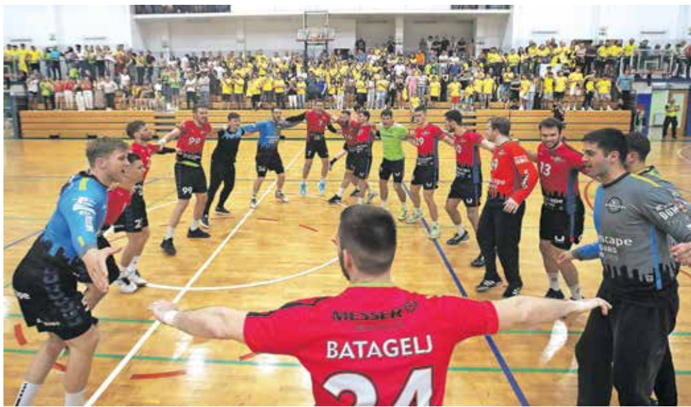
Škofjeloški rokometišči so se takole veselili petkove zmage v Radovljici. / Foto: Gorazd Kavčič

Že v Škofji Loki, kjer je približno polovica občinstva navijala za domačine, druga pa za goste, je bilo vzdušje dobro. V Radovljici je šlo vzdušje še vsaj za stopničko višje. V dvorani Srednje gostinske in turistične šole je bila peščica gledalcev, ki so pesti stiskali za gostujočo ekipo. Večinski del, po večini oblečen v rumene