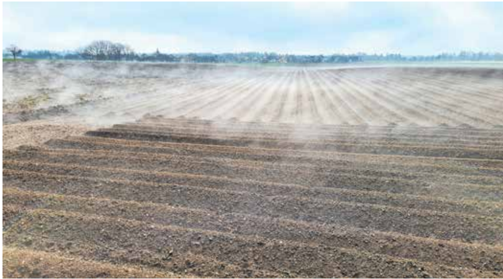
Po podatkih geodetske uprave so bile cene kmetijskih zemljišč na Gorenjskem lani najvišje v državi. Slika je simbolična.

Na ravni države so se lani cene kmetijskih zemljišč zvišale za šest odstotkov, v obdobju 2018–2023 pa za dobri dve petini.