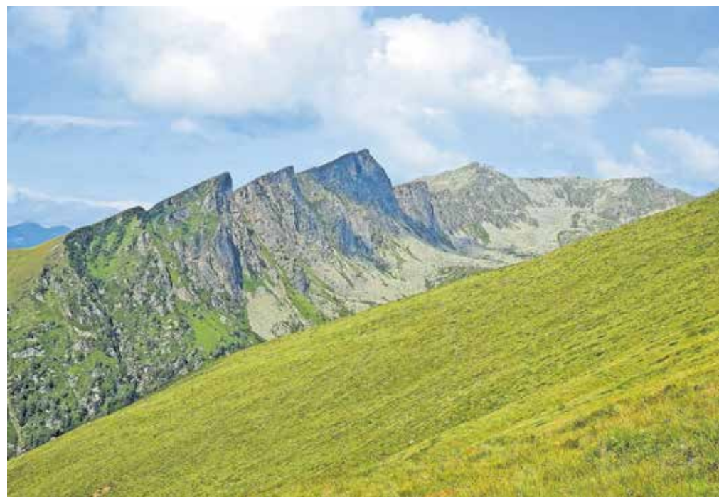
Pogled na dolino Hintergraben. Glavni koničasti vrh v grebenu je Böse Nase.

Prečna pot najprej poteka naravnost, nato se malce spusti. Po krajšem času vztrajanja na isti izohipsi pa se spusti na markirano pot št. 565, po kateri smo se vzpenjali. Po njej se vrnemo do koč. Predlagam, da si tam privoščimo nekaj domačega. Koča je namreč znana po lokalnih