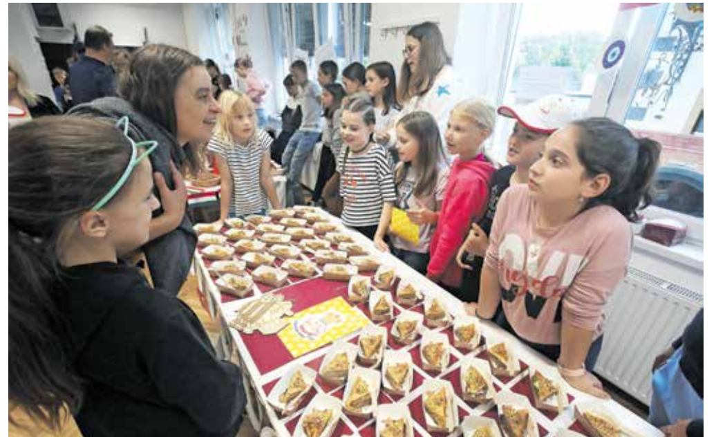
Učenci OŠ Staneta Žagarja so presenetili s svojo različico turške baklave s slovenskim nadevom. / Foto: Gorazd Kavčič