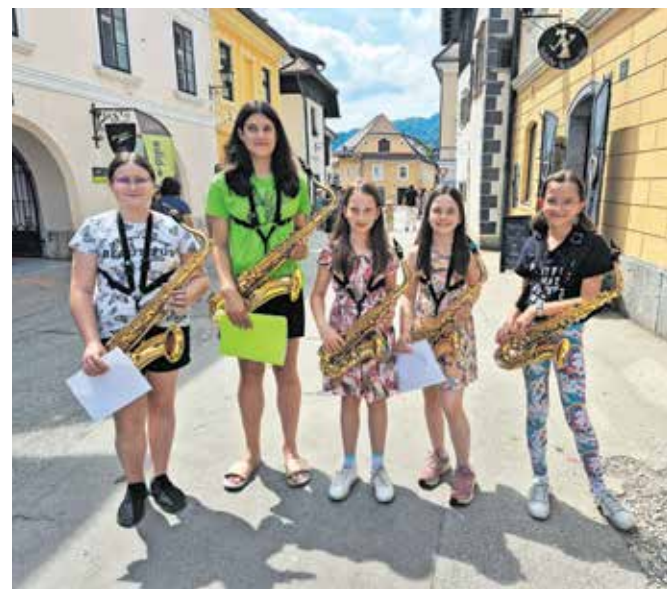
Skupinica učenk saksofona je bila po nastupu na Trgu pod gradom dobre volje.