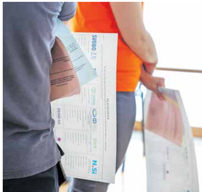
Štetje glasovnic z nedeljskih evropskih volitev in posvetovalnih referendumov se je zavleklo dolgo v noč. Kot je pojasnil predsednik Državne volilne komisije Peter Golob, so morali volilni odbori prešteti kar 2,5 milijona glasovnic.