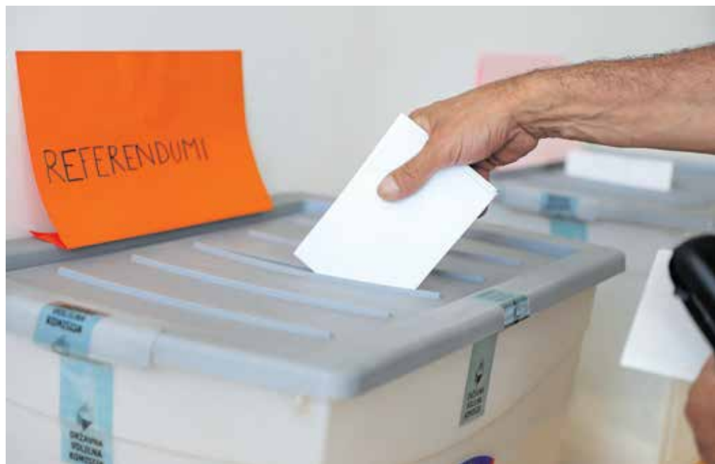
Gorenjski volivci so bili poleg volivcev v volilni enoti Ljubljana Bežigrad edini, ki so zavrnil referendumski predlog o dopustitvi konoplje za osebno rabo.

SDS je slavila v desetih od enajstih volilnih okrajev, le v volilnem okraju Jesenje je največ glasov pobrala Svoboda, in sicer 30,34 odstotka, kar je za približno štiri odstotke več kot največja opozicijska stranka. SDS je daleč najbolj prepričljivo zmago z 42,73 odstotka glasov dosegla v volilnem okraju Škofja Loka 2 (Poljanska in Selška dolina). Najtesnejši