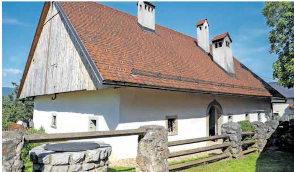
Prešernova domačija je kulturni spomenik, ki je v celoti v državni lasti, zato izvaja prenovo ministrstvo za kulturo, upravlja pa jo Zavod za turizem in kulturo Žirovnica.