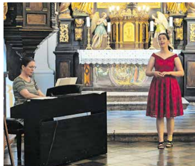
V Špitalski cerkvi so se med drugimi predstavile tudi učenske solopetja.