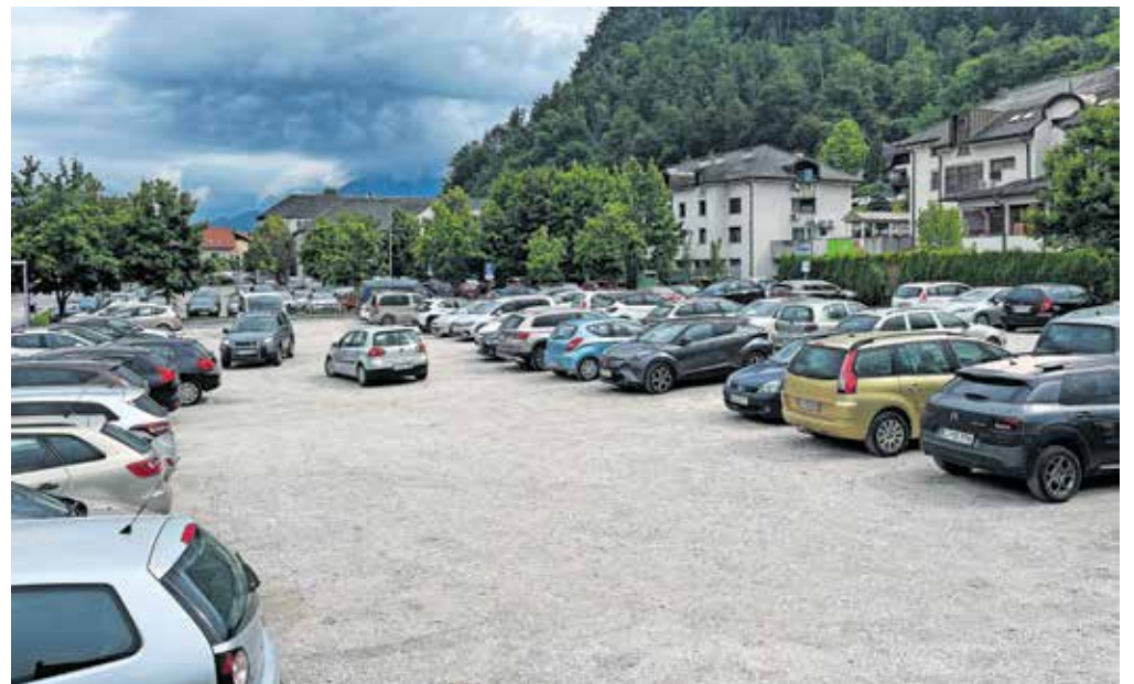
V Kamniku si želijo urediti problematiko mirujočega prometa

»Občina je takrat pridobila prva mnenja k občinskemu podrobnemu prostorskemu načrtu in mnenje o potrebnosti izdelave celovite presoje vplivov na okolje. V skladu z zahtevami nosilcev urejanja prostora je tako naročila okoljsko poročilo in ga poslala v potrditev ministrstvu za okolje, podnebje in energijo. S strani omenjenega ministrstva smo 11. aprila 2024 prejeli pripombe, da