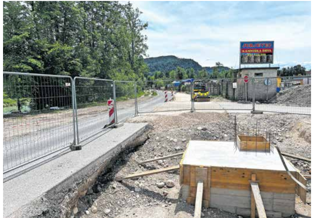
Na cesti ob nekdanji smodnišnici poteka obnova vodovoda.

Gre za državno cesto, zato bo Direkcija Republike Slovenije za infrastrukturo cesto tudi v celoti preplastila, na kamniški občini pa si z državo prizadevajo skleniti tudi dogovor, da bi cesto razširili tako, da bodo lahko na