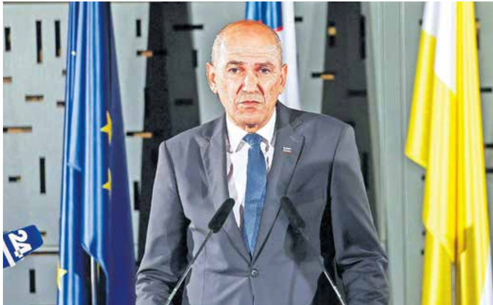
Janez Janša, predsednik SDS: »Vladna koalicija je na teh volitvah izrazito poražena.«

Ljubljana – Prvak SDS Janez Janša je v prvem odzivu na izide evropskih volitev, na katerih je njegova stranka zmagala že četrty zapored, skupaj z NSi pa sta desnoredinski parlamentarni stranki prejeli pet od devetih evropskih mandata (trije mandati) pozval k odstopu. »Gre za sporočilo slovenskega volilnega telesa aktualni vladajoči koaliciji, naj naredi podoben premislek, kot ga je naredil francoski predsednik države Macron (razpustil parlament, op. p.) ali pa belgijski predsednik vlade, ki je pravkar odstopil.