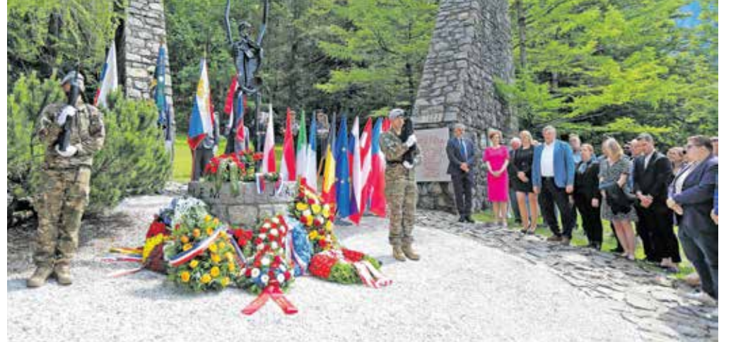
Vence so položili ob spominskem znamenju Obtožujem/J'accuse

Odzvanzjale so ministrične besede, da je čas, da slišimo glas zgodovine, ki nas opozarja in roti, naj ne ponovimo napak preteklosti. »Naj bo končno že dovolj ubijanja in trpljenja, dovolj diskriminacije in rasizma,