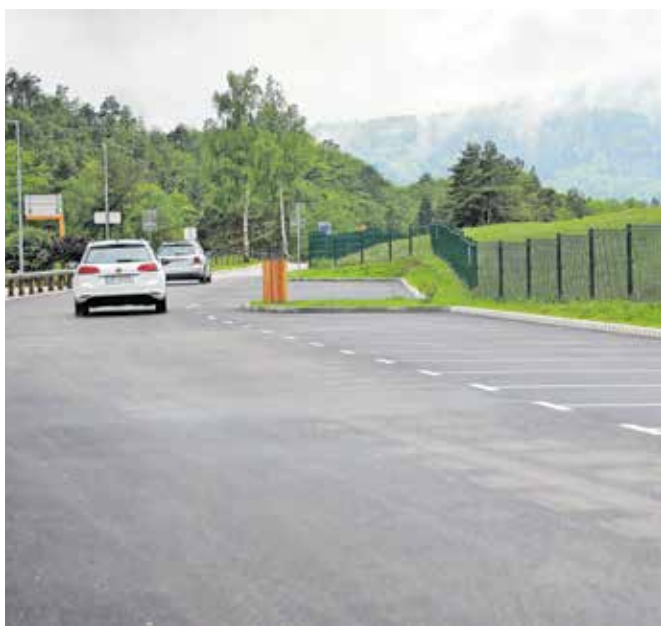
Čeprav je Občina Žirovnica v dolini Završnice vzpostavila dodatna parkirišča, se še vedno pojavlja problem nepravilnega parkiranja.

Obiskovalci namreč še vedno parkirajo zunaj označenega območja, predvsem ob cesti, ki vodi do Valvasorjevega doma, Medobčinski inšpektorat in redarstvo občin Jesenice, Gorje, Kranjska Gora in Žirovnica pa je ob tem poostiril nadzor nad nepravilnim parkiranjem. Zaradi pravne kvalifikacije prekrškov pa oseb na tem