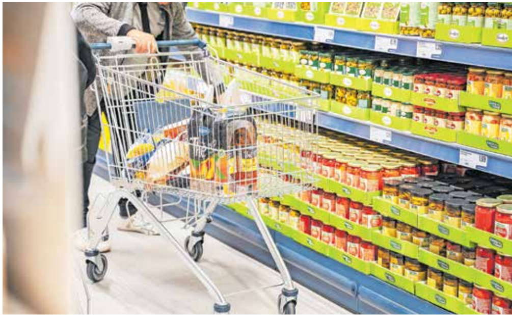
Med drugimi storitvami socialnih servisov obsegajo tudi nakupovanje in prinašanje živil.