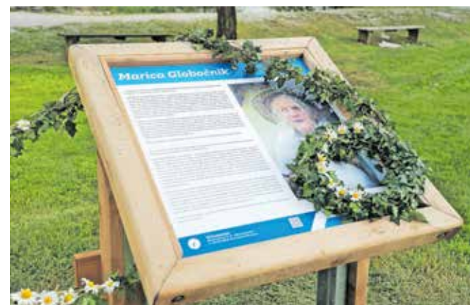
Spominska tabla Marici Globočnik - teti Pehti