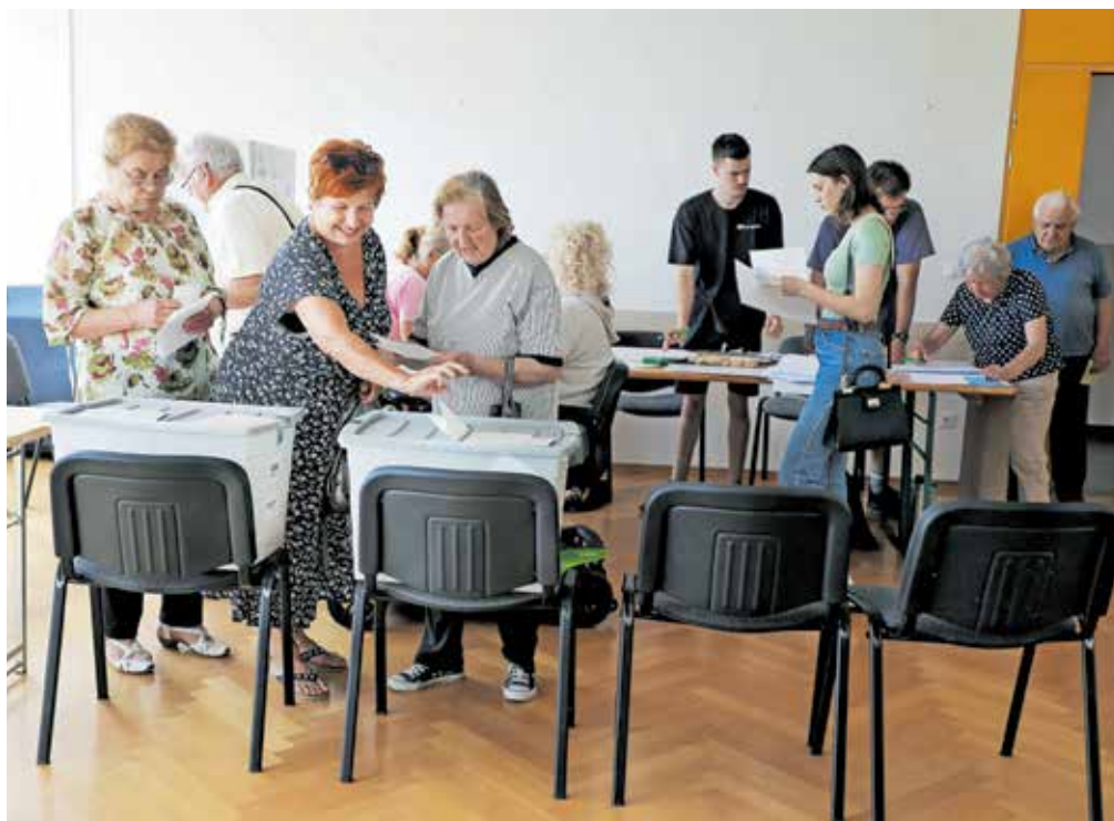
Na letošnjih volitvah v Evropski parlament je glasovalo 698.083 oziroma 41,34 odstotka volivcev. To je najvišja volilna udeležba na evropskih volitvah doslej.