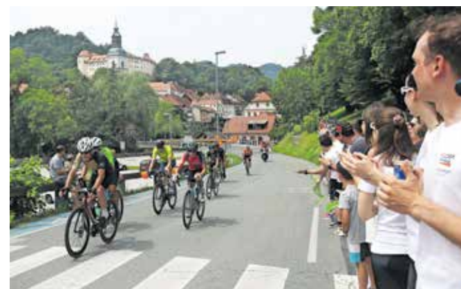
Odlično navijaško vzdušje na Maratonu Franja je postalo tradicija, tudi v Škofji Loki.