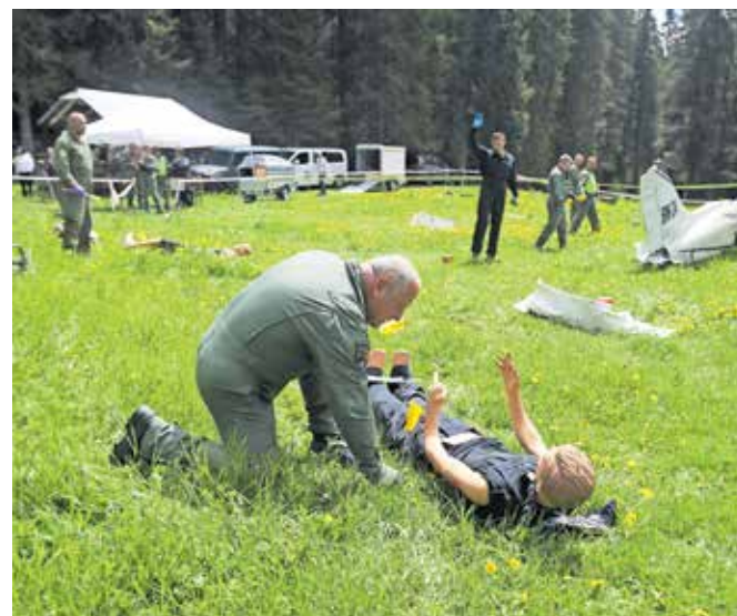
Z vsakokratno izvedbo vaje se izboljšujejo protokoli in postopki, kar prispeva k večji varnosti v vojaškem letalstvu in zmanjšanju tveganja nesreč v prihodnosti.

»Preiskave, ki jih izvajamo na vaji, so vedno usmerjene v prihodnost. Na našem nebu je vse več drogov, ki se vedno bolj uporabljajo tudi v vojaške namene, zato se tem razmeram ustrezno prilagajamo,« je poudaril Klavžar in dodal,