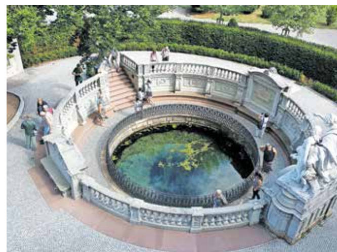
Izvir Donave v mestu Donaueschingen

čez planoto Stöcklewald, kjer stoji 25 metrov visok razgledni stolp, do izvira potoka Breg. Ob potoku Breg nato pot vodi nazaj do mesta Donaueschingen.