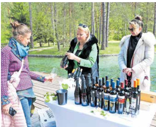
Pop Up Wine Festival je veliko več kot zgolj vinski festival, saj združuje tako ljubitelje vina kot kulinarike.