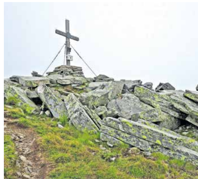
Križ na vrhu Gmeinecka

Z vrha nadaljujemo proti vzhodu, po poti 563 v smeri Bergfriedhütte. Čudovit greben nas pelje na Stoder (2433 m n. m.). Pot do tja je zavarovana, a povprečno uhojenemu gorniku ne povzroča nobenih težav. Jeklenice so zgolj kot ograja, da je hoja po izpostavljenem terenu varnejša. S Stoderja se vrnemo na markirano pot in sestopimo po pobočju do smerokazov, ki nas usmerijo nazaj do Kohlmaierhütte. Odvisno od letnega časa, a ta pobočja so bujna z borovničevjem, njegovi sadeži pa izjemno okusni.