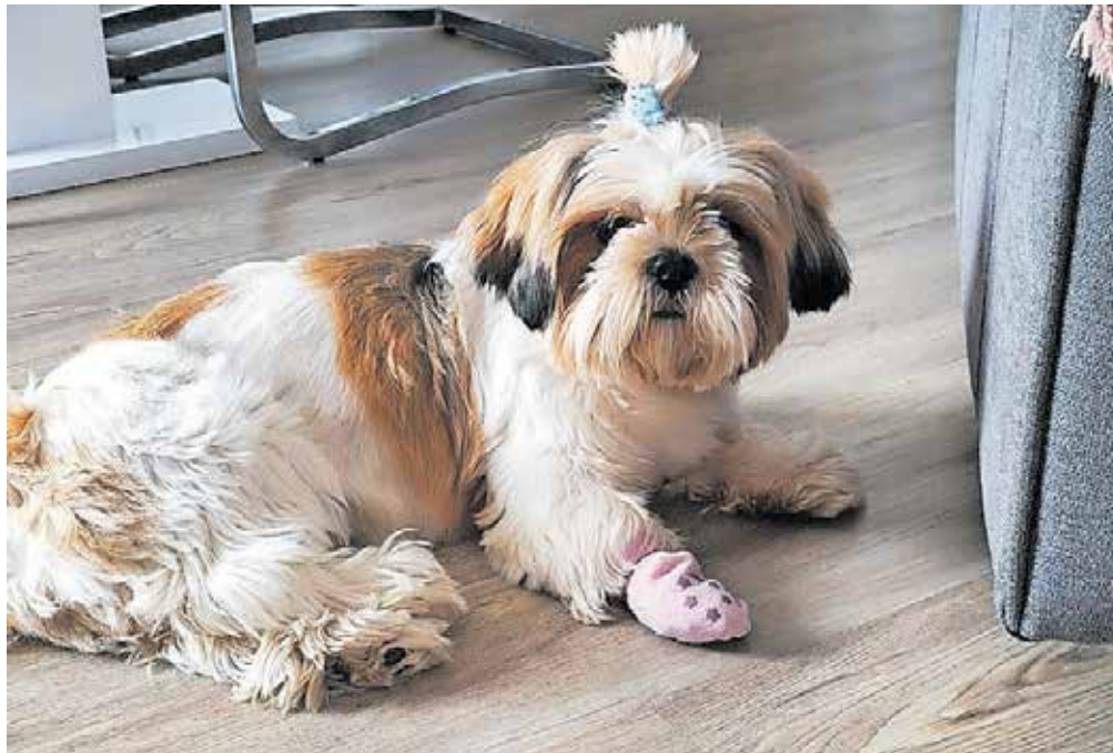
Lili se je v želji, da se vrne domov v Kranj, podala na nevarno popotovanje, polno izzivov, ki se je kljub vsemu srečno končalo.

Kadar pes pobegne, sta prva dva dneva ključna, saj v