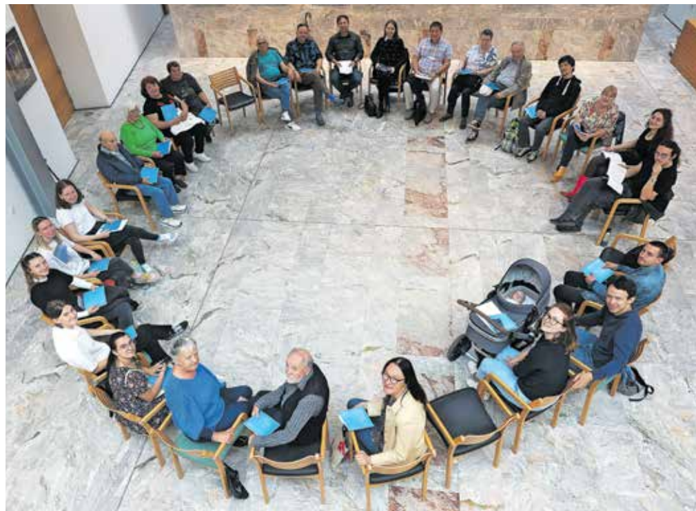
Zaokrožena skupina avtorjev prispevkov v 45. številki literarne revije Sejalec

V nadaljevanju je Miha Mohor v uvodu dejal, da je bila Zveza kulturnih organizacij v sedemdesetih letih ustanovljena, da bi strokovno pomagala ljudem, ki se amatersko ukvarjajo