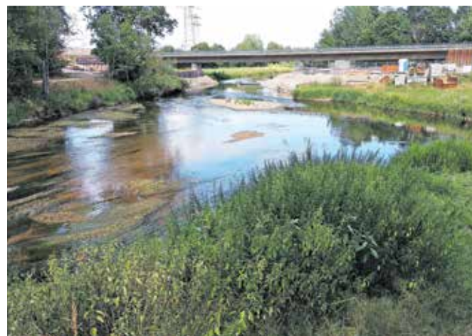
Reka Donava se začne na sotočju potokov Brigach in Breg.

delom kolesarske poti od izvira v mestu Donaueschingen do Passaua, ki leži na nemško-avstrijski meji, pa smo se srečali avgusta 2019. Donava izvira v nemškem mestu Donaueschingen, ki leži v Schwarzwald na jugozahodu Nemčije v zvezni deželi Baden-Württemberg. Prvi dan smo se po