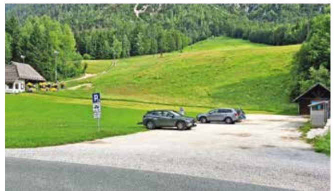
Začetek gradnje novega parkirišča pod smučiščem v Mojstrani, dela bodo končana v septembru. / S. K., Foto: Mito Kostadinovski