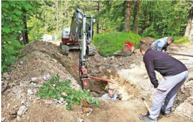
Sanacija javne poti v Naselju Ivana Krivca; pikiranje skale, izkop in izvedba meteorne kanalizacije v zadnji tretjini trase ceste. Sledi polaganje telekomunikacijske cevi in javne razsvetljave.