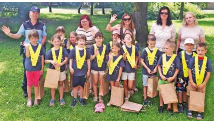
v OŠ 16. decembra Mojstrana