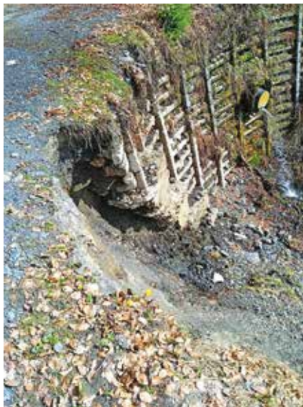
V prvi fazi sanacije se ureja tudi gozdna cesta Rateče–Poljana.

rov in ponovno gozdna cesta v Suhelj ter ceste v Kot, Mlinco, Brevant ... Škode je bilo po oceni za več kot 1,15