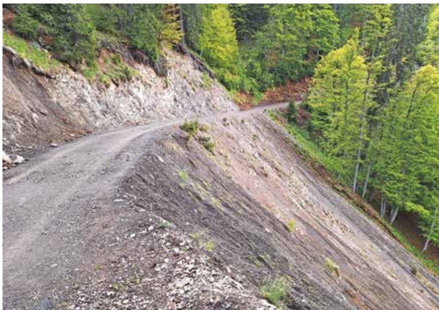
Sanacija gozdne ceste na Suhelj

rov in ponovno gozdna cesta v Suhelj ter ceste v Kot, Mlinco, Brevant ... Škode je bilo po oceni za več kot 1,15