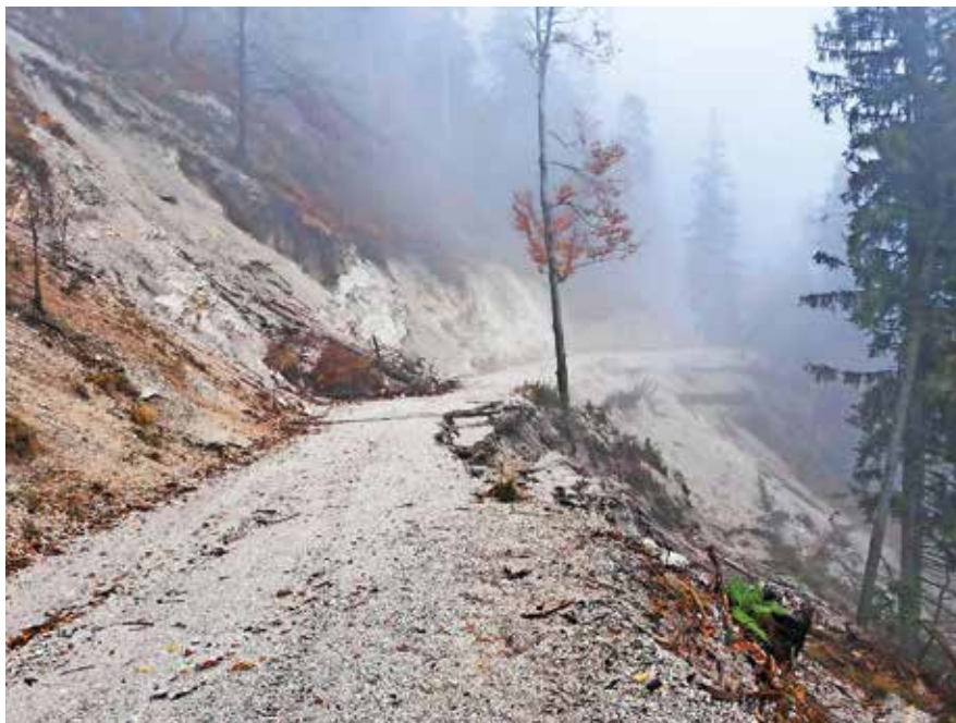
Izdelan je že tudi projekt sanacije gozdne ceste Barakarjev rovt.

omogočili tudi sanacijo vetrolomov. Država je z interventnimi ukrepi zagotovila 40 odstotkov avansnih sredstev za začetek sanacije gozdnih cest. Izvedeni so bili projekti za izvedbo sanacije, razpisi za izbiro izvajalca del, tako da sanacija v občini Kranjska Gora že uspešno poteka, izbrani izvajalec del pa je podjetje Ažman, je povedal Mertelj. »V prvi fazi sanacije se urejajo gozdne ceste v Suhelj, Rateče-Poljana,