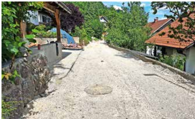
Sanacija vodovoda v zgornji ulici novega naselja na Dovjem je zaključena. Pripravlja se že tamponska podlaga za asfalt.