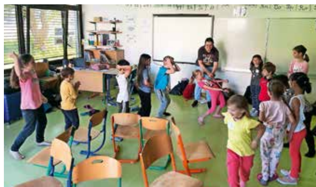
Večer je bil zabaven kot že dolgo ne.