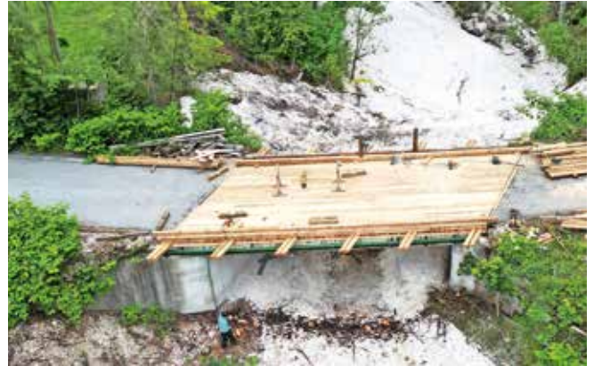
Sanacija lesenega dela mostu čez Kotarico v Zgornji Radovni je v zaključni fazi. V delu je mostna ograja, sanirajo betonske poškodbe na mostni konstrukciji in urejajo okolico.