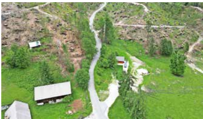
Sanacija brežin Biščkovega klanca v Zg. Radovni. Po vetrolomu se urejata brežini, ponikovalnica, vzdolž klanca bo varnostna ograja.