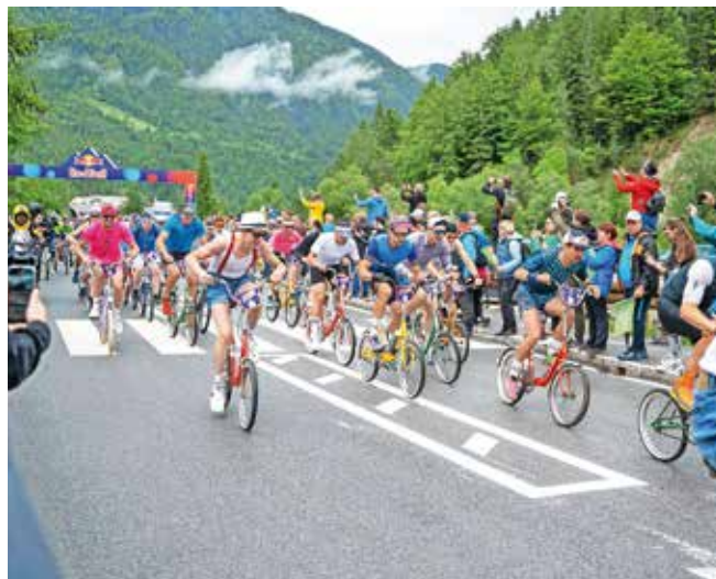
Pa naj bo cilj zmag, osebni rekord ali morda le priti do cilja...