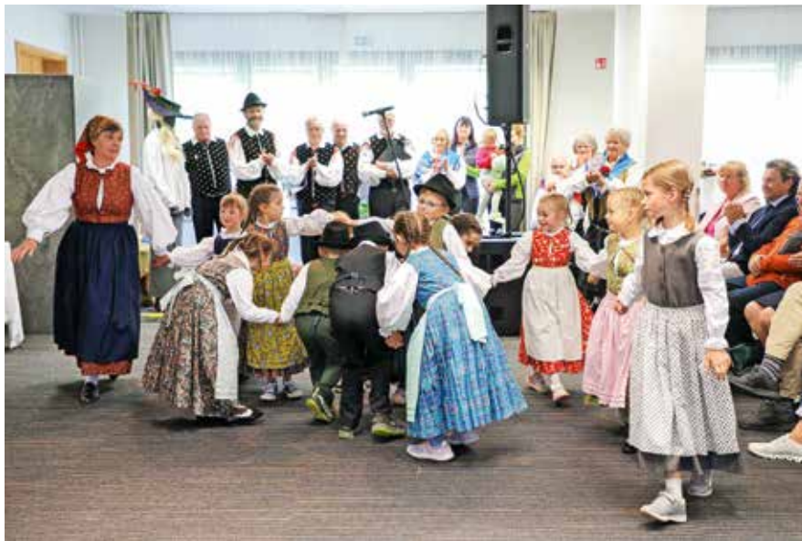
Mladi folklorniki iz vrtca v Ratečah so navdušili z nastopom.