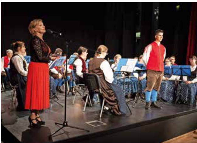
Slavnostni koncert so 22. junija izvedli tudi v Kranjski Gori.