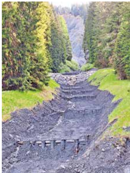
Sanacija zaplavnih pregrad ob gozdni cesti na Suhelj

»V avgustovskih poplavih s škodnim dogodkom 4. avgusta so bile najbolj poškodovane gozdne ceste Barakarjev rovt ter ceste v Krnico, Tamar in na Macesnovc. Ocenjena škoda je znašala skoraj 106 tisoč evrov. V novembrskih poplavih, še posebno močno deževje z nalivi je bilo 3. novembra, so bile najbolj poškodovane gozdne ceste v zaledju Belce, dodatno Barakarjev