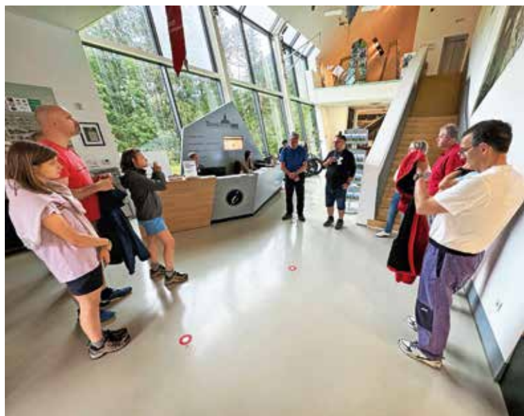
Z vodenja po razstavi

V Slovenskem planinskem muzeju v Mojstrani letos nadaljujejo izvedbo bogatega programa. Poleg stalnih zbirk je na ogled muzejska dokumentarna razstava Gore in srčnost ob 100-letnici Planinskega društva Jesenice. Vrstijo se muzejski večeri in različne predstavitve, veliko je zanimivih interaktivnih vsebin. Skupaj z drugimi izvajalci so pomembno sooblikovali izvedbo tretjega športno-avanturističnega konca tedna, ki je potekal pod imenom Outdoor festival Mojstrana. Med drugim je obsegal pohode v gore z gorskimi vodniki, tečaj varnega gibanja po feratah ter športnega plezanja in družinski izlet Po poteh triglavskih pravljič. Otroke so posebno navdušili člani Društva GRS Mojstrana, ki so predstavili svoje zahtevno delo pri reševanju planincev in drugih obiskovalcev gora, ko se znajdejo v težavah. V okviru Poletne muzejske noči so pripravili vodenje po razstavi Gore in srčnost in zabavni večer z Mitjem