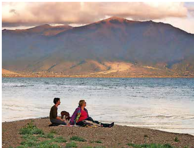
V petek, 19. julija, vabljeni na ogled dokumentarnega filma Telo.

Vstop na filmske večere je brezplačen, v primeru slabega vremena bodo projekcije na skednju Liznjekove domačije.