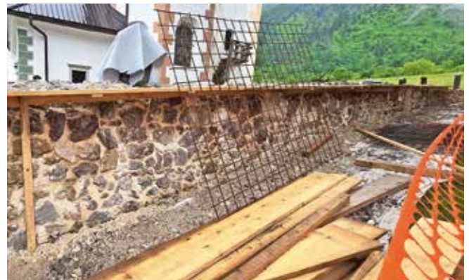
Fugiranje kamnitega zidu na pokopališkem zidu na Dovjem je končano. Nad zidom bodo izdelali še armiranobetonsko krono.