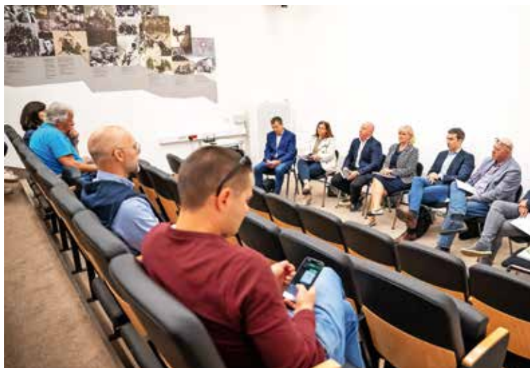
Sestali so se v planinskem muzeju.

Julija in avgusta je na voljo tudi brezplačni turistični avtobus po destinaciji Kranjska Gora, namenjen obiskovalcem in domačinom. Vozni redi (tudi za dolino Vrata) so objavljeni na spletni strani Turizma Kranjska Gora, na avtobusnih postajališčih ..., do njih lahko dostopate tudi s priloženo QR kodo.