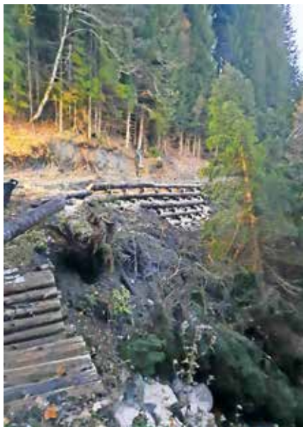
Gozdna cesta Železnica-Jureževa planina, sanacija je skoraj zaključena