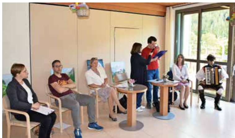
Literarni večer v Kranjski Gori so posvetili Josipu Vandotu.