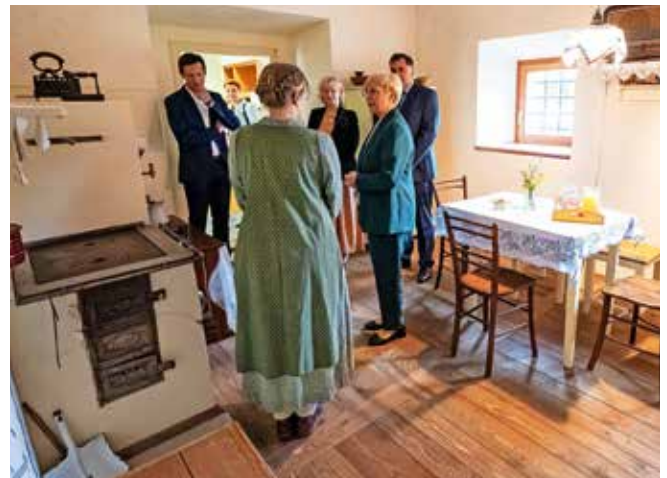
S predsednico države Natašo Pirc Musar med ogledom stalne etnološke razstave o načinu življenja delavskih družin na Jesenicah