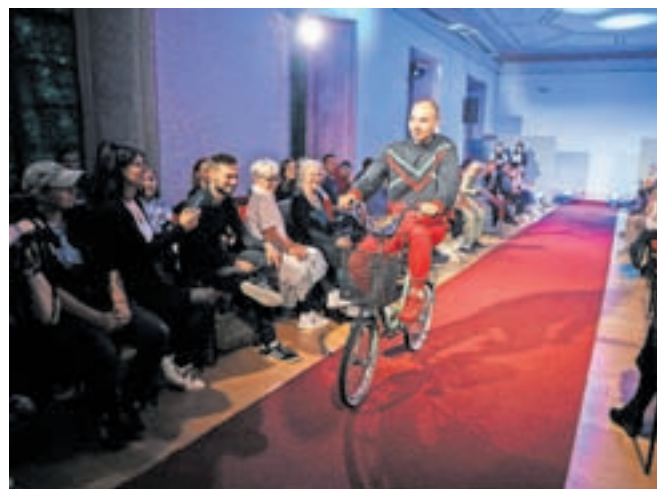
Modna revija je bila vse prej kot dolgočasna, za kar so pumovci ob navdušenju občinstva poskrbeli tudi z nekaterimi zanimivimi rekviziti.

Program PUM, ki ga izvaja Ljudska univerza Radovljjska, je zasnovan za mlade, ki so iz različnih razlogov prekini formalno izobraževanje. Cilj programa je spodbujanje osebnostnega razvoja,