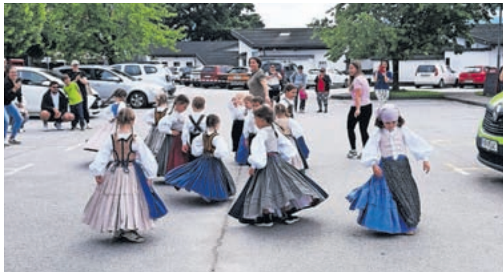
Prireditev se je začela z nastopom najmlajših plesalcev folklorne skupine Vrtca Lesce.