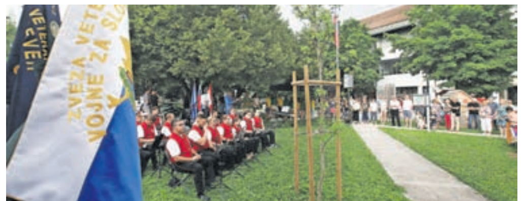
Slovesnost ob dnevu državnosti je bila tudi letos pri Lipi samostojnosti.

Prenova sistema lokalne samouprave je bila med prvimi pomembnimi projekti nove samostojne in demokratične Republike Slovenije. Cilj nove sistemske zakonodaje je bil doseči, da občine postanejo čim sodobnejše in čim bolj delujoče uprave, ki zagotavljajo kakovostne in dostopne javne storitve, je spomnil. Poudaril je, da so občine danes pomemben gradnik