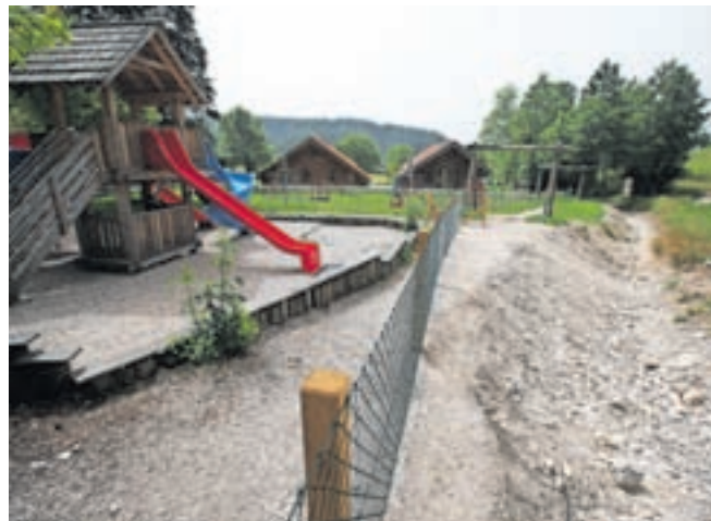
Otroško igrišče v Krpinu je v smeri proti strugi potoka zavarovano z ograjo.

Nekaj več informacij je na voljo tudi glede sanacije ceste v Drago. »Kakšen bo prometni režim v času iz-