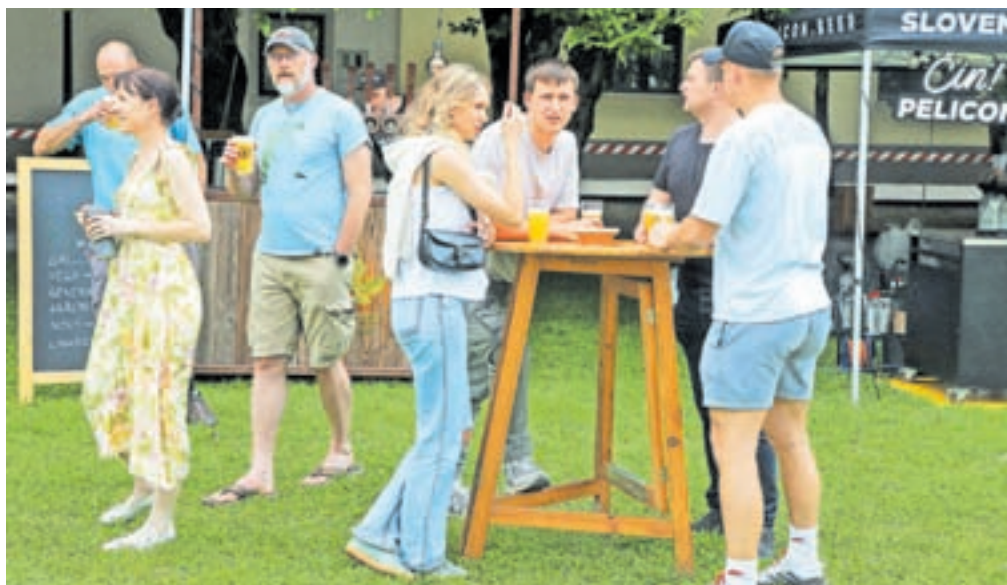
Nekateri so prišli iz radovednosti, mnogi pa zaradi raznolike ponudbe piva, hrane in dobre glasbe.

Poleg bogate pivske ponudbe so organizatorji poskrbeli tudi za najmlajše obiskovalce, ki so se lahko zabavali s poslikavo obraza, preizkusili v lokostrelstvu in sodelovali v različnih animacijah. Za glasbeno popestritev pa so zadolžili skupine Guni z Jesenic, Kokosy ter IF Floyd Tribute to Pink Floyd.