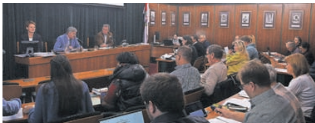
Seja občinskega sveta Občine Radovljica

Občinski svet je potrdil drugi rebalans letošnjega proračuna, ki se z dodatnega pol milijona evrov zvišuje na 27,8 milijona evrov na prihodkovni in 34,2 na odhodkovni ravni. Rebalans proračuna je bil pripravljen predvsem zaradi pričakovanih državnih sredstev za sanacijo enajstih gozdnih cest po lanskim ujmi, za postavitev treh samooskrbnih sončnih elektrarn na objektih v lasti občine, pa tudi za obnovo šolskega igrišča v Begunjah in telovadnice radovljiške osnovne šole, za kar je občina pridobila sredstva države, so pojasnili na občinski upravi. Z rebalansom so tudi zagotovili zadostna sredstva za dokončanje druge in tretje faze obnove Klinarjeve hiše v Kropi ter za prilagoditev občinskih cest ob rekonstrukciji regionalne ceste in obnovi