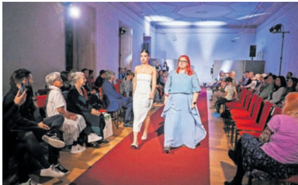
Športno, elegantno, skrivnostno, klasično... – vse to je bilo mogoče videti.