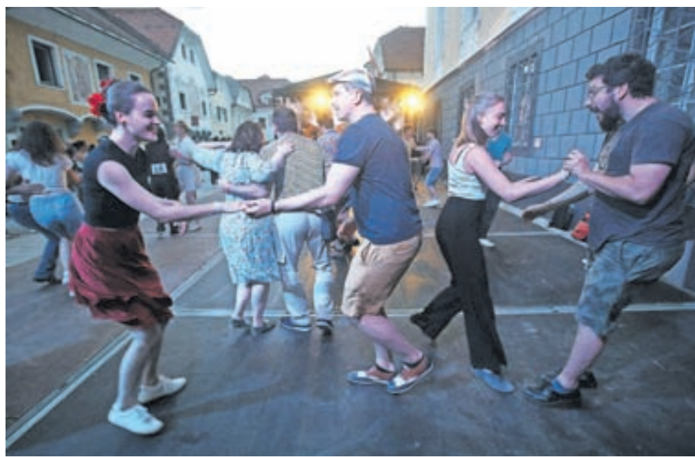
Prejšnji konec tedna je Radovljica v starem mestnem jedru že tretje leto zapored gostila priljubljeni festival svinga Shake the Change.