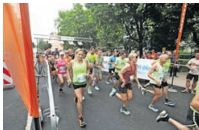
Praznovanje dneva državnosti že dvanajsto leto zapored spremlja tekaška prireditev Radol'ska 10ka.