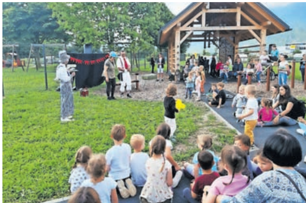
Namen medgeneracijskega srečanja je druženje vseh generacij v kraju.

Organiziran je bil ogled galskega doma v Lescah. Za zaključek pa so se najmlajši udeleženci pomerili v spretostni igri v prenašanju kozarcev v vodo in bili vsi nagrajeni.