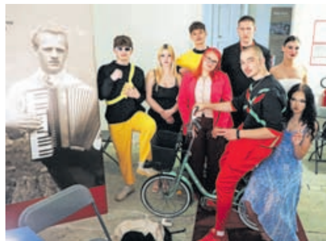
Že pred začetkom modne revije je v zaodrju vladala dobra energija. Mladi so bili pripravljeni, da stopijo na modno brv.

spodbujanje odgovornega ravnanja z viri in da lahko s predanostjo dosežejo izjemne rezultate. Njihove kreacije so nas opomnile, da moda lahko združuje estetiko in etiko ter da je prihodnost v rokah mladih, ki znajo misliti zunaj okvirov in delovati v dobro skupnosti in okolja.