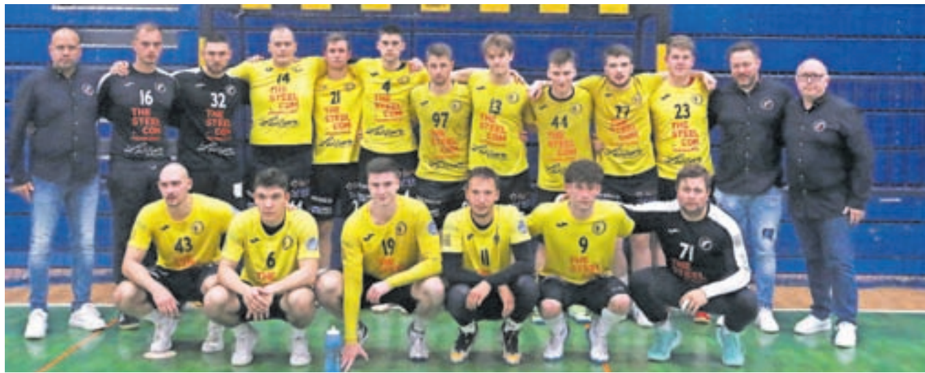
Rokometaši Frankstahla Radovljica so se do zadnje tekme borili za napredovanje v 1. A ligo.

Rednega dela sezone niso začeli najbolje. Na prvih štirih tekmah so dvakrat zmagali v gosteh, obe domači tekmi pa so izgubili. Nadaljevanje je bilo sanjsko. Do konca so izgubili le še dve tekmi in dvakrat igrali neodločeno, obakrat v gosteh. Oba poraza so dosegli proti novemu prvoligašu, ekipi iz Krškega. Mirno lahko rečemo, da so bili obakrat blizu, da bi lahko odnesli točko ali celo dve. V Krškem so v zaključku zgrešili dve sedemmetrovki zapored, kar so gostitelji kaznovali. V Radovljici je bila tekma izenačena do zadnjih minut, na koncu pa je bilo videti, kot da so se Radovljičani ustrašili zmage. Krčani so redni del končali na prvem mestu s 45 točkami, Radovljičani so bili drugi z 38 točkami, rokometiški Šmartnega pa tretji s 35 točkami. Poglejmo vse re-