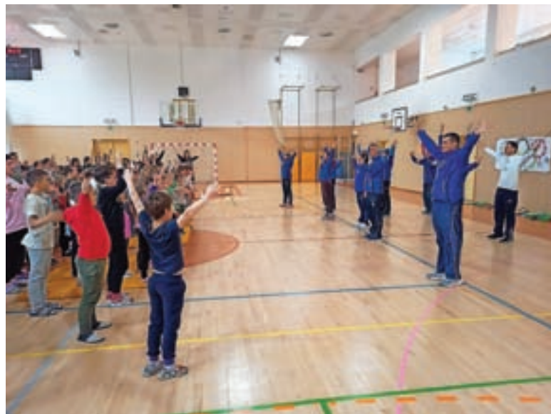
Še nekaj vaj za razgibavanje