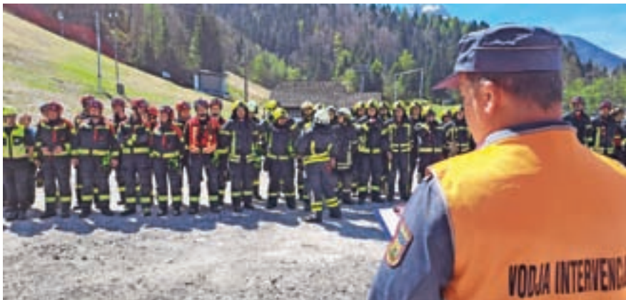
Vaja je bila dobro načrtovana in izpeljana.

Aprila je zagorelo na težko dostopnem terenu na Medvejku nad Podkorenem. Gozdarji so sekali drevje in požigali veje, ogenj pa jim je ušel izpod nadzora. Lastnik gozda si je zlomil stegenico, gozdarji so dobili opekline in utrpeli ureznine z žago. Na pomoč so se takoj odpravili gasilci, ki so se zaradi podrtega drevja težko prebili do cilja. A na srečo se je vse dobro izteklo, saj je bil to le scenarij gasilske vaje. Kot je povedal