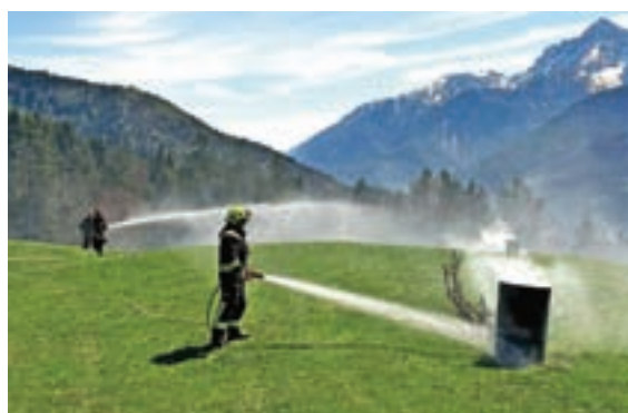
Intervencija na terenu