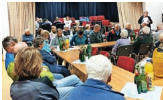
Občni zbor PD Gozd Martuljk

Program izletov, pohodov ter drugih aktivnosti za letošnje leto je dostopen na spletni strani društva. Letos bo tudi slavnostna akademija ob 75-letnici društva in 10-letnici gozdne učne poti. Več bo tudi vzdrževalnih in investicijskih del na plezalni steni in na večnamenskem igrišču. Na Bivaku pod Špikom bodo zamenjali tablo in solarni akumulator ter opravili tekoče vzdrževanje. Pregledali in po potrebi tudi popravili bodo vse štiri planinske poti, za katere skrbi društvo.