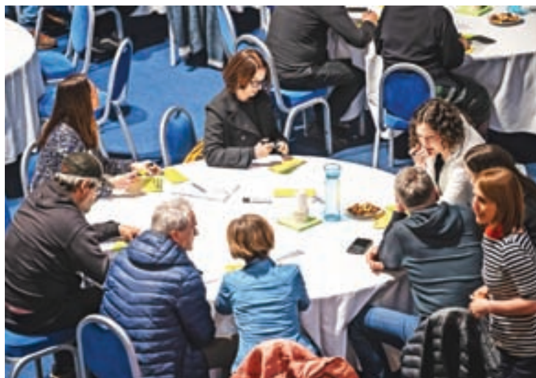
V petih omizjih je na odprti delavnici za splošno javnost nastalo več predlogov za bolj trajnostni pristop.

Na podlagi razprav z delavnic in ugotovitev iz februarja in marca izvedene ankete so pripravljavci že predlagali področja, kjer v obstoječi strategiji vidijo potrebne spremembe, in se o tem pogovorili s člani Strateške skupine; drugo