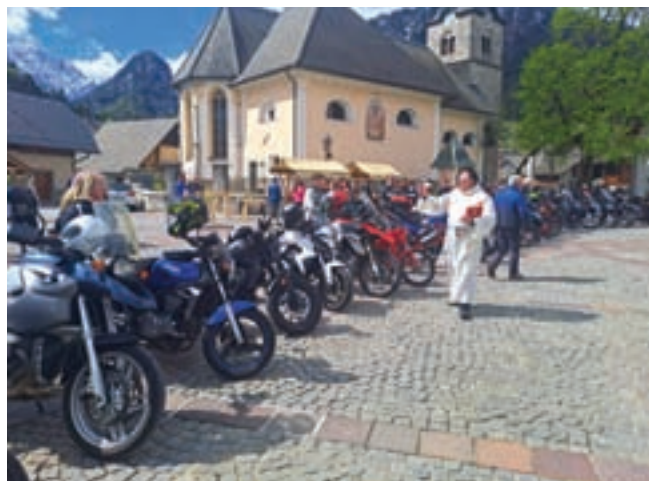
Blagoslov motorjev in motoristov