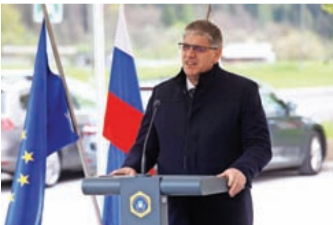
Nagovor ministra za notranje zadeve Boštjana Poklukarja