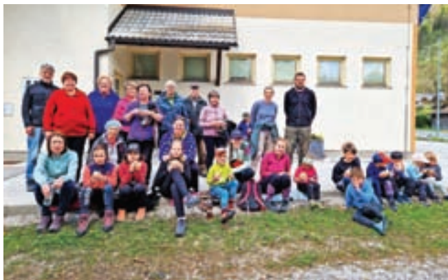
V Gozdu - Martuljku so na čistilno akcijo povabili Krajevna skupnost »Rute« – Gozd - Martuljek in Srednji Vrh, tamkajšnje turistično društvo, planinsko društvo, prostovoljno gasilsko društvo in Mladinsko društvo Rute.