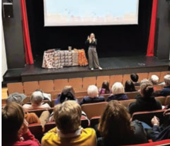
Predavanje Neže Jakelj