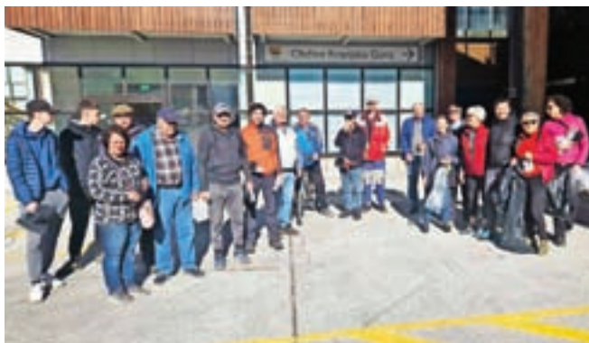
Ekipa, ki je v Kranjski Gori poskrbela za čistejše okolje