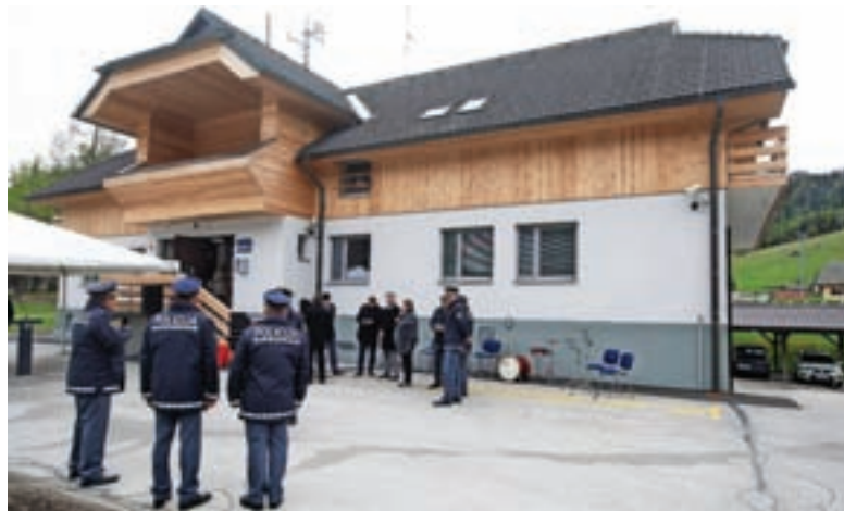
Stavba je obnovljena v alpskem slogu in se lepo umešča v okolje.