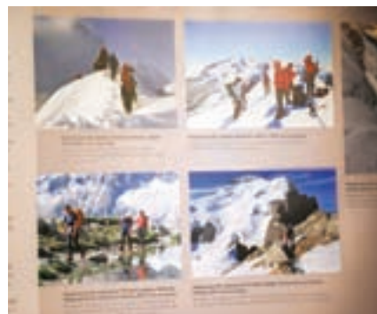
Razstava je v planinskem muzeju na ogled do prvega junija.