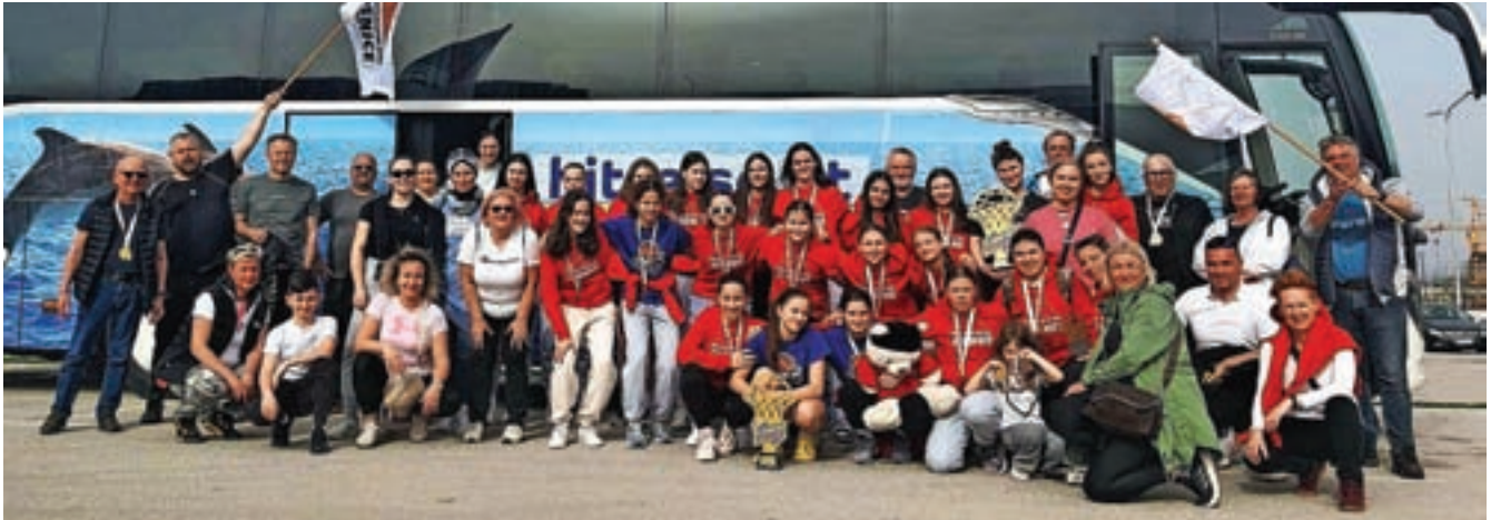
Ekipa na poti v Sarajevo

Kranjskogorsko-jeseniški klub je na turnirju v Sarajevu dosegel prvo mesto v kategoriji U18 in tretje mesto v kategoriji U14.