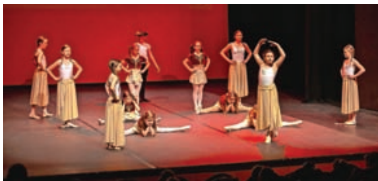
Iz baletne predstave – Igra kontrastov, plesna pripravnica 3, Kranjska Gora

GLASBENA ŠOLA JESENICE, CESTA FRANCIETA PREŠERNA 48, JESENICE