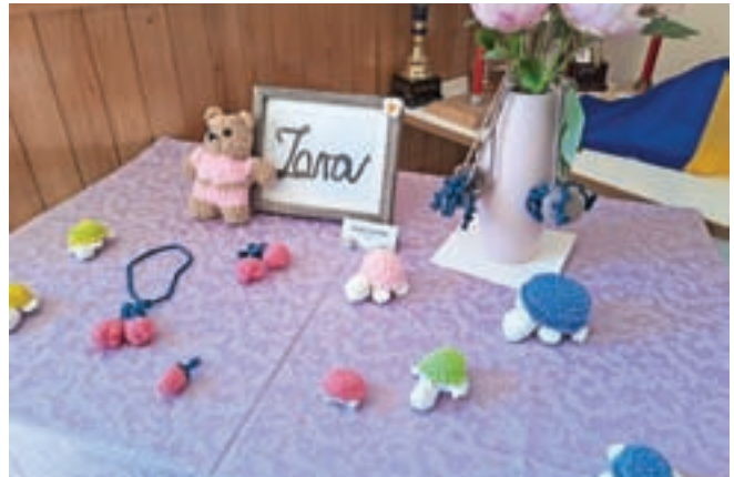
Kvačkani izdelki 10-letne Zare v Podkorenu