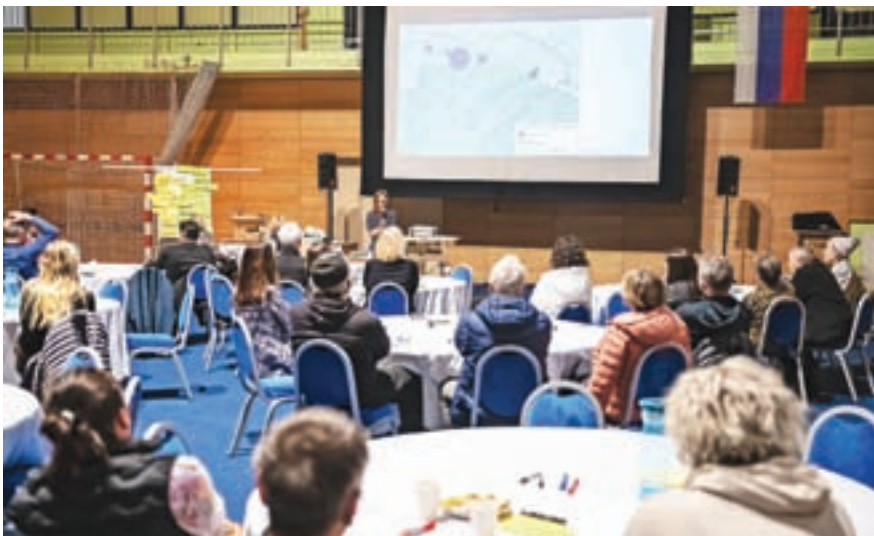
Odperte delavnice za splošno javnost se je v petek, 5. aprila, udeležilo več kot trideset občanov.

Povabili so tudi na t. i. odprto delavnico za splošno javnost, ki se je v petek, 5. aprila, udeležilo več kot trideset občanov, ki so poudarili, da so posebno ponosni na gorsko naravo in njeno ohranjanje, omenili pa skrb, da je ne bi preveč obremenili. Domačini si želijo