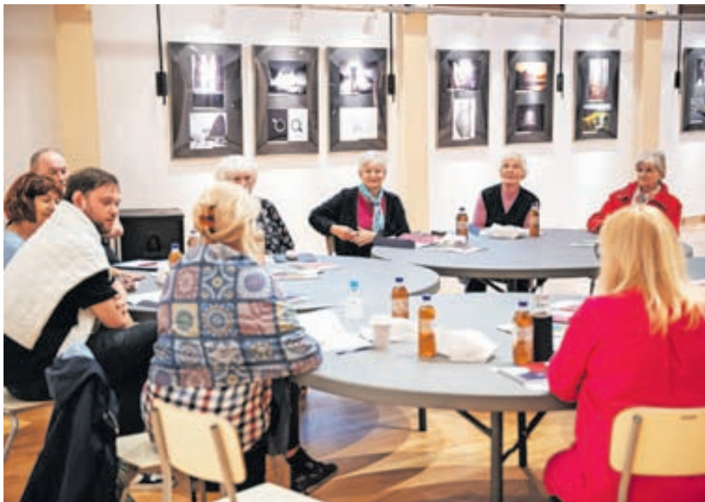
Tako so se na dogodku V zavetju besed zbrali odrasli literati Gorenjske.