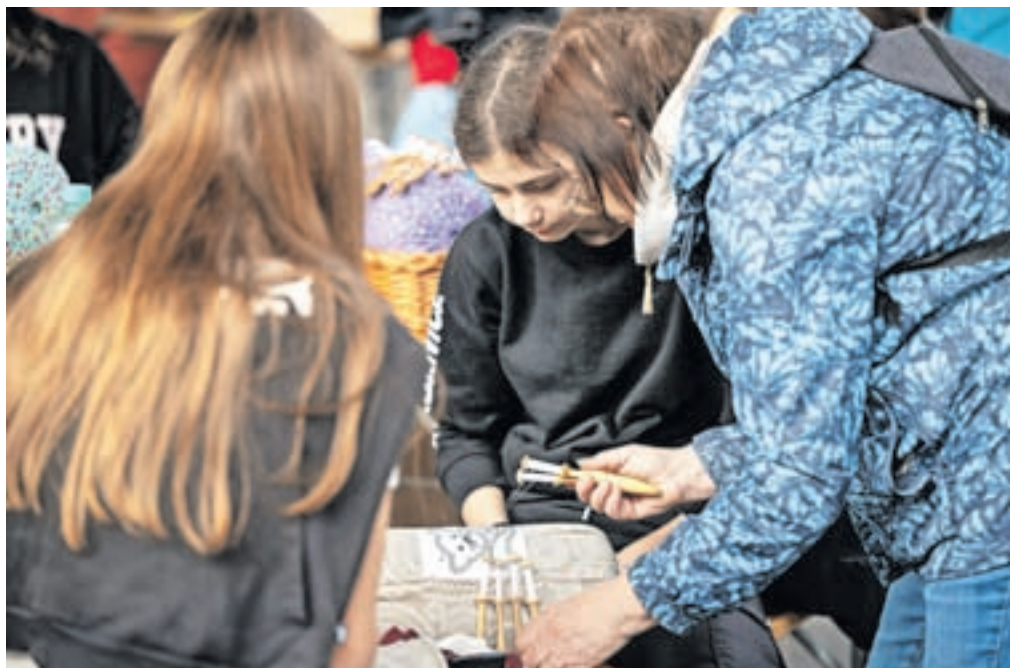
Ročna dela so še kako cenjena.

ki so jih pripravili na Srednji šoli Jesenice, pri sekciji ročnih del Društva upokojencev Jesenice, ustvarjati je bilo mogoče z društvom Žarek, z VDC-jem, Vrtcem Jesenice, OŠ Poldeta Stražičarja, OŠ Prežihovega Voranca ter mnogimi drugimi. Na več kot dvajset stojnicah so se predstavljali Društvo diabetikov Jesenice, Ragor, Glasbena šola Jesenice, Gimnazija Jesenice, jese-