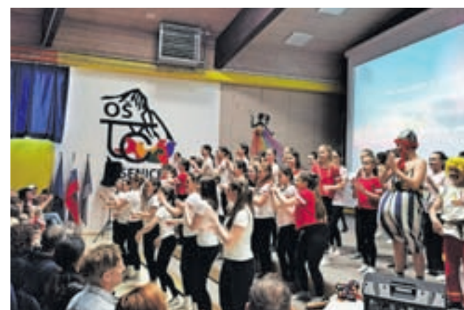
Pomladni plesni nastop