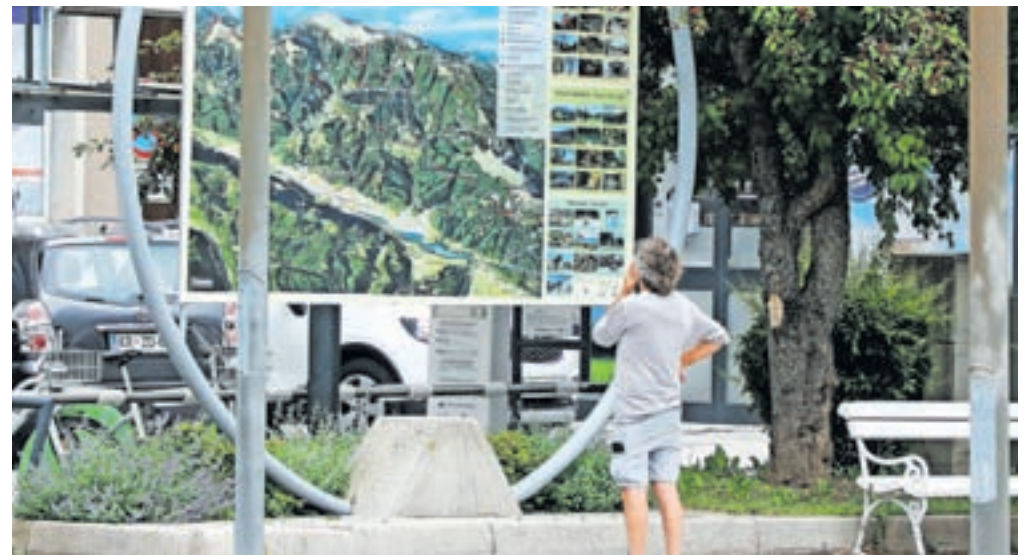
Občinski svetniki se niso strinjali z dvigom turistične takse.

Je pa nadzor nad sofinanciranjem dejavnosti javnega mestnega prometa in šolskih prevozov opravil tudi nadzorni odbor Občine Jesenice. Kot izhaja iz poročila, ki ga je na seji predstavil