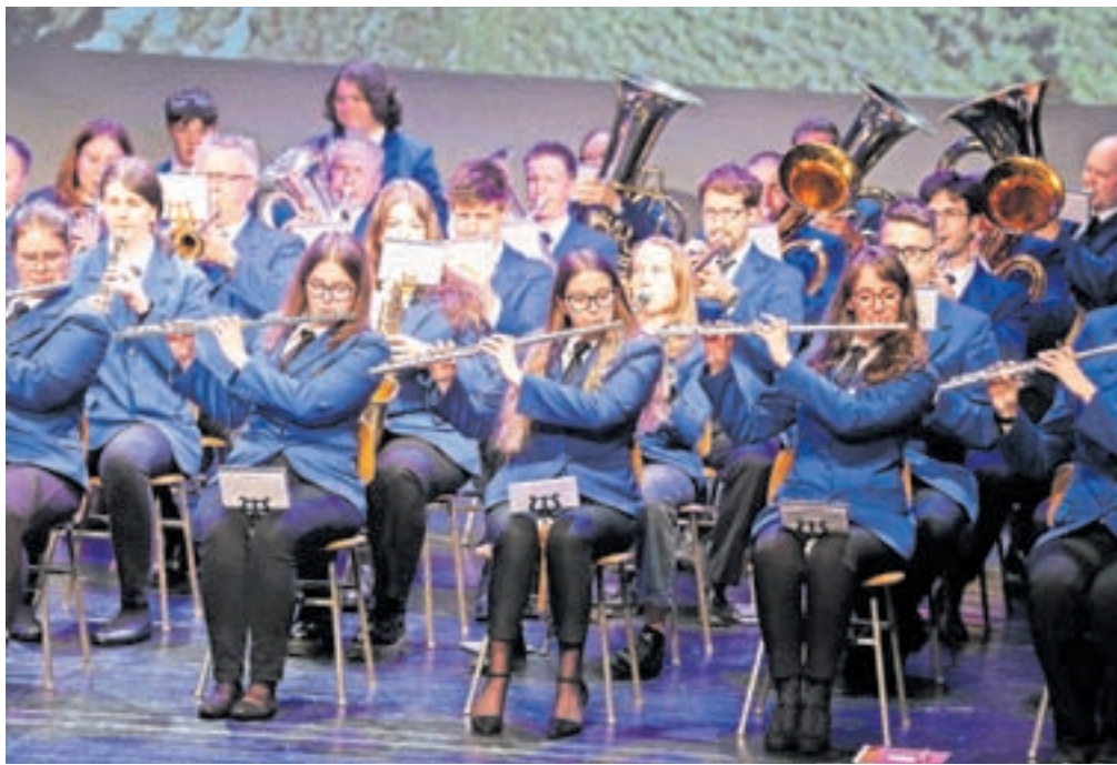
Pihalni orkester Jesenice - Kranjska Gora je zaznamoval 150 let delovanja.