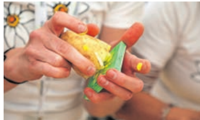
Naloge niso bile najtežje, a vsekakor vse prej kot popolnoma preproste.