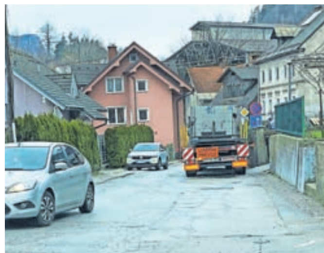
Tovornjaki z nekaj ton težkimi ploščami so do obrata podjetja SIJ Acroni prisiljeni voziti po ozki cesti skozi vas.

Sušanj. Skrb vzbujajoče je predvsem dejstvo, da po ozki cesti vozijo tovornjaki z več ton težkimi ploščami, mimo pa poteka šolska pot in vsakodnevno hodijo otroci.