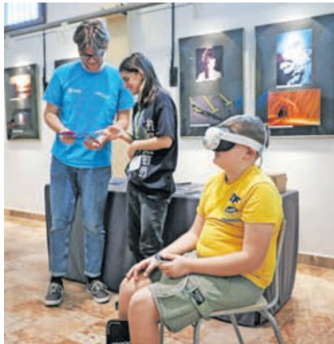
Pripravili so tudi virtualni sprehod po vesolju.