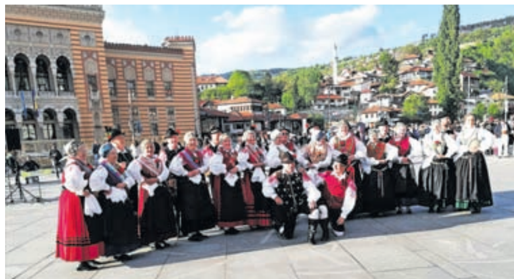
Folklorna skupina Juliana v Sarajevu