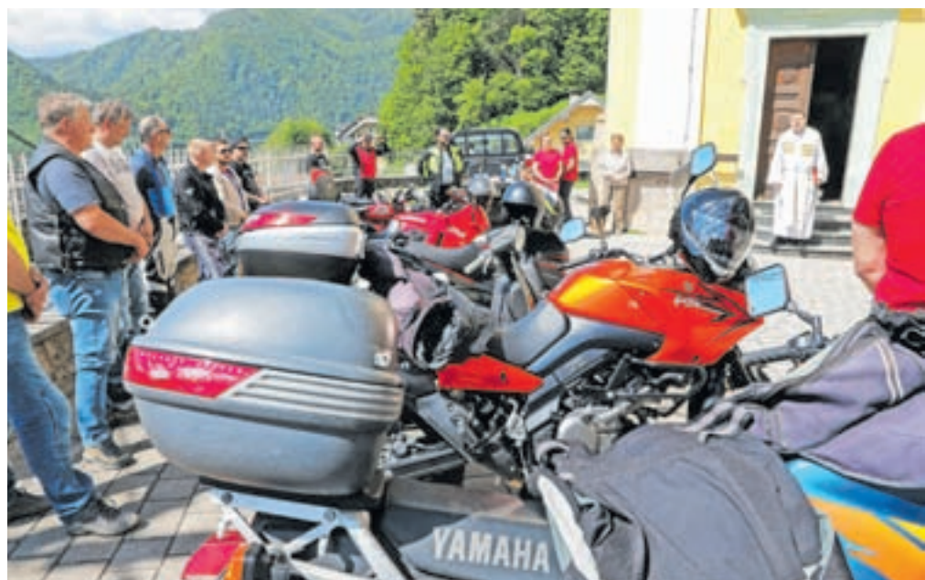
Kar nekaj motoristov se je udeležilo tradicionalnega blagoslova motorjev na Koroški Beli.

njak in dodal, da se veliko motoristov počuti na cesti bolj varne, če se udeležijo tovrstnih priložnosti. V društvu se po Zlodnjakovih besedah združujejo stari in