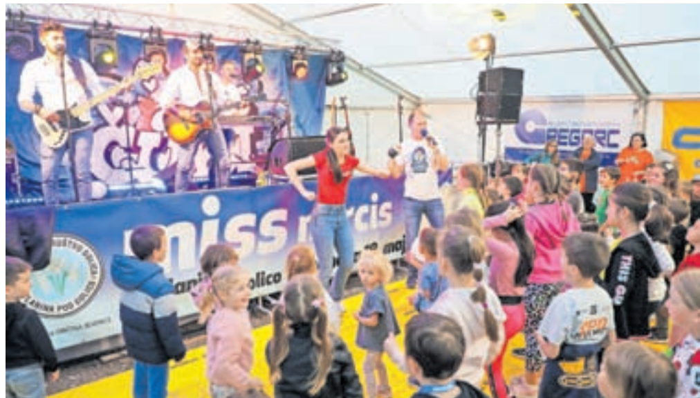
Čuki so poskrbeli, da se je zabavalo staro in mlado.

tako ostaja pomemben del kulturne dediščine Planine pod Golico. Dogodek ne le povezuje skupnost, ampak tudi ohranja tradicijo in spodbuja mlade k aktivnemu sodelovanju. Skozi leta se je prireditev spreminjala, vendar njen osnovni namen – povezovanje in praznovanje lokalne kulture – ostaja enak.