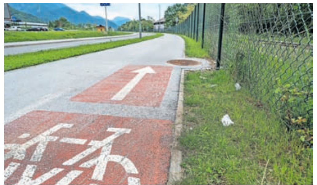
Ena od pobud se nanaša na postavitev več košev za smeti v mestu.

V občinski upravi so predlog podprli, zato bodo glede na