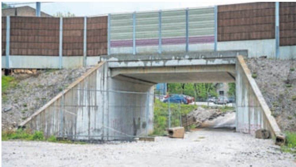
Novi podvoz pod železniško progo je zgrajen, denar za izgradnjo povezovalne ceste pa je država razporedila na druge projekte ...

V KS Slovenski Javornik - Koroška Bela že dalj časa opozarjajo na problematiko prometne varnosti, zlasti na odseku ceste do obrata za predelavo debele pločevine podjetja SIJ Acroni. Srečevanje vozil je oteženo, slabo pa je poskrbljeno tudi za varnost pešcev; ne nazadnje ob cesti poteka tudi šolska pot. Potem ko je bil v sklopu prenove železniške proge zgrajen podvoz pod železniško progo, so bili izdelani tudi projekti za gradnjo povezovalne ceste, ki bi razbremenila vas. Po dogovoru naj bi v projektu sodelovali Občina Jesenice, SIJ Acroni in država. Povezovalna cesta naj bi se približno sto metrov od obstoječega semaforiziranega križišča pri SIJ Acroniju usmerila desno čez neurejeno parkirišče, nato pa naj bi bila speljana pod novim železniškim podvozom in se pri mostu čez potok Javornik priključila na obstoječo traso. V sklopu projekta bi uredili tudi novo križišče z državno cesto R2, parkirišča