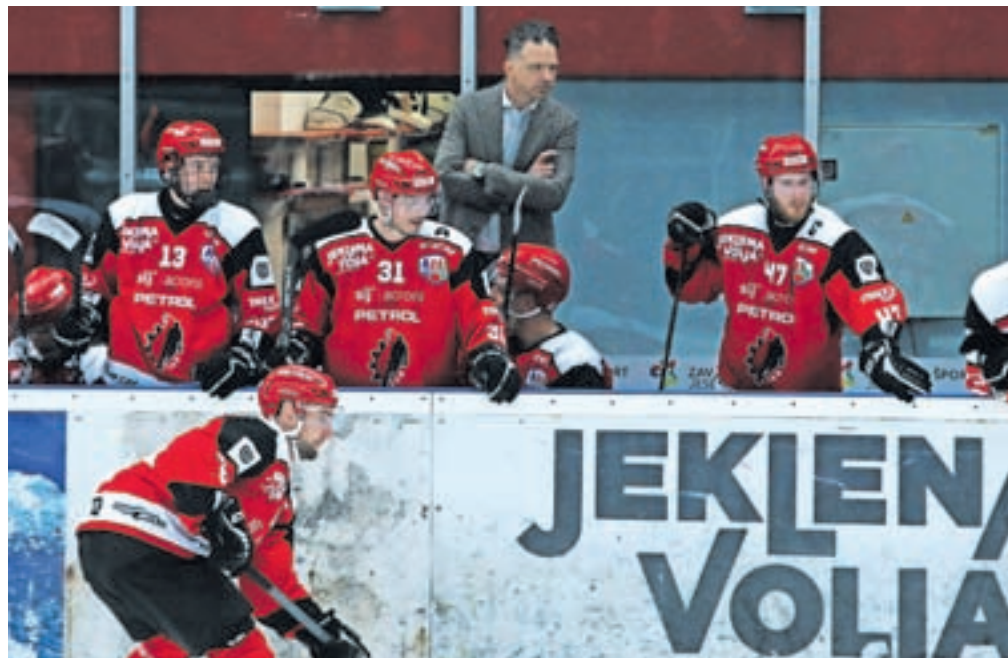
Minula sezona je že zgodovina in treba je obrniti nov list in se ozreti v sezono 2024/2025.

Minula hokejska sezona v dvorani Podmežakla se je končala z naslovom državnega prvaka. Prav ste prebrali, a treba je še dopolniti, da se je naslova veselila mladinska ekipa Jesenic. Mladinci so ponovili uspeh iz sezone 2022/2023, ko so bili v dramatičnem finalu praktično že v izgubljenem položaju, a na koncu vseeno boljši od Olimpije. V minuli sezoni so bili v finalu boljši od kranjskega Triglava. Članska ekipa je sezono prav tako končala s finalom državnega prvenstva, v katerem so s 4 : 0 v zmagah izgubili proti Olimpiji. Finale bo ostal v spominu po dveh izredno slabih tekmah Jesenic v Tivoliju in po dveh dobrih predstavah v domači dvorani, kjer so nudili dostojen odpor. O Alpski ligi ne velja pretirano izgubljati besed. Dober začetek niti približno ni ogrožal končnice. Žal je bilo nadaljevanje slabo, z veliko padci in na koncu so ostali brez uvrstitve med osmerico. Čeprav je bila ekipa, ki je igrala v minuli sezoni, po kakovosti malce slabša od tiste, ki je osvojila Alpsko ligo, sem še vedno prepričan, da je bila uvrstitev med osmerico najboljših popolnoma dosegljiva.