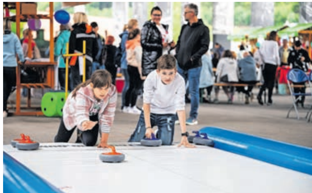
Obiskovalci so se lahko preizkusili tudi v curlingu.