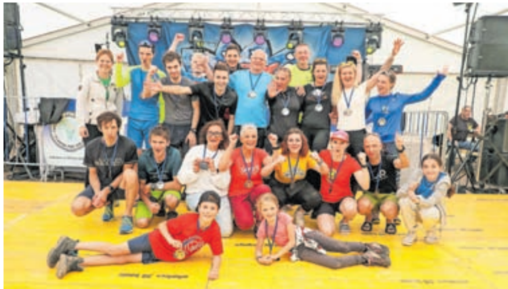
Prejemniki medalj za tekaško preizkušnjo 6 ur Španovega vrha