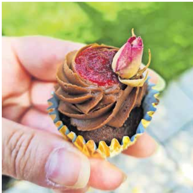
Mini čokoladni mafin z vrtničnim džemom