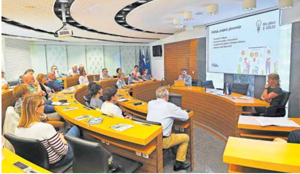
V Domžalah so že sprejeli predlagatelje projektov, ki jih bodo izvedli v prihodnjih mesecih.

1500 občanov izglasovalo 29 projektov. Za projekte, katerih realizacija je v celoti v pristojnosti občine, je načrtovana izvedba še letos. Za projekte, ki za izvedbo zahtevajo različna soglasja ali projektno dokumentacijo, pa so sredstva za načrtovanje in pridobivanje soglasij rezervirana v letošnjem letu, izvedba pa bo sledila prihodnje leto. Še pred začetkom izvedbe projektov oziroma