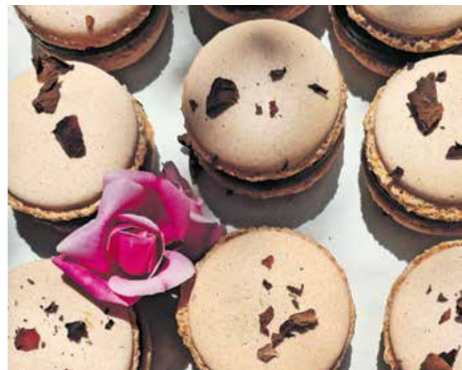
Vrtnični makroni