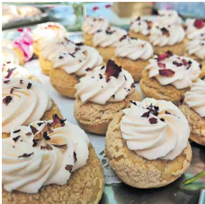
Princeske z jagodami in vrtnično kremo