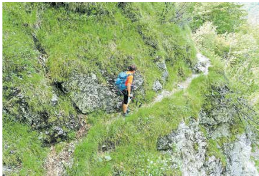
Izpostavljena prečka v delno podrtem svetu, kmalu na začetku poti.

Nadmorska višina: 1620 m Višinska razlika: 1070 m Trajanje: 5–6 ur Zahtevnost: ★★★★★