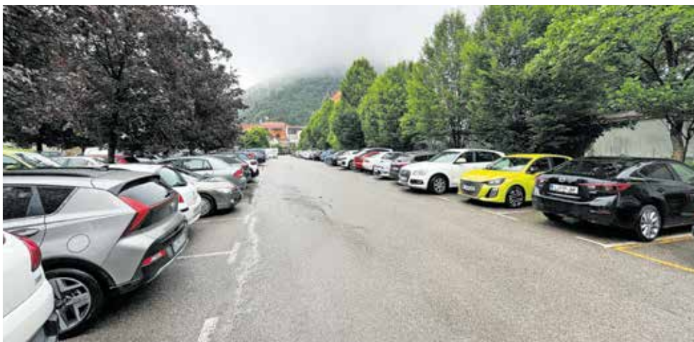
V Kamniku se obeta posodobitev sistema parkiranja

Uporabniku omogoča, da z uporabo pametnega telefona uredi parkiranje, po potrebi tudi na daljavo podaljša čas parkiranja in na koncu poravnava račun. Sistem je povezan z upravljavcem parkirišč, zato redarji vidijo, da ima določeno vozilo aktivirano parkirnico, in ne izrečejo globe. Kljub temu pa bodo v Kamniku še vedno omogočali tudi plačevanje z gotovino, kot je to veljalo doslej. Kot pravi kamniški župan, bodo cene ostale na podobni ravni. Danes ura parkiranja na plačljivih parkiriščih v mestu stane pol evra.