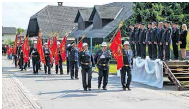
Častljiv jubilej so počastili z gasilsko parado.

Kranj – Letno kopališče v Kranju se je uradno odprlo že 10. junija, a do 21. junija med tednom obratuje le od 14. do 22. ure, ker so dopoldnevi rezervirani za treninge vaterpolske reprezentance Hrvaške. Od sobote bo tako kopališče vse dni spet obratovalo od 9. do 22. ure. Tudi letos bodo na kopališču potekale različne aktivnosti za otroke na vodnem poligonu. Poletne dejavnosti vsakodnevno izvajajo tudi na Gibi Gibu.