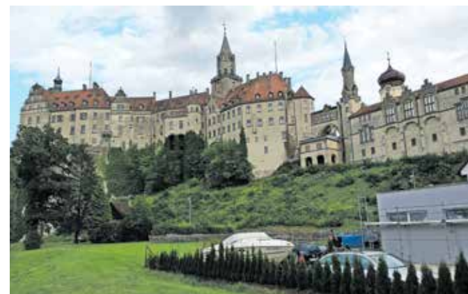
Sigmaringen – grad Hohenzollern

zavoj, se nad Donavo dviga mogočna skala, na kateri je grad Gutenstain. Mimo ruševin gradu Dietfurt in Dietfurtovega mlina smo prispeli v Inzigkofen, ki je znan po samostanu.