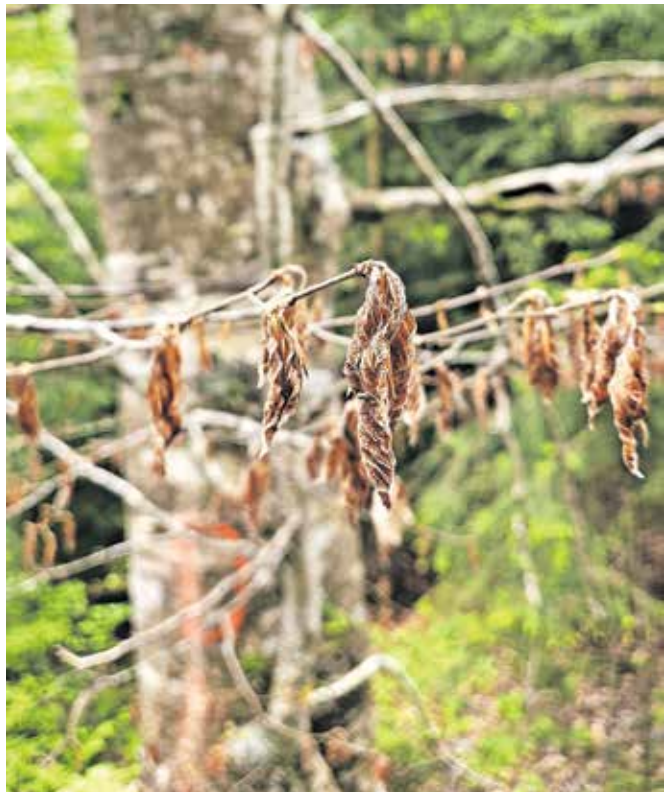
Posledica letošnje spomladanske pozebe na bukvi