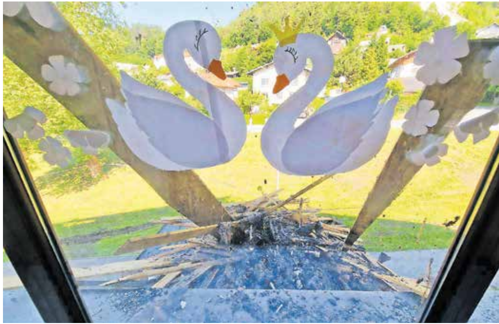
Sanacijo bi radi začeli čim prej, da bi bila končana do prvega septembra.

Direktor občinske uprave Meglič je povedal, da si je nekaj gradbincev že ogledalo pogorišče in pričakujejo njihove