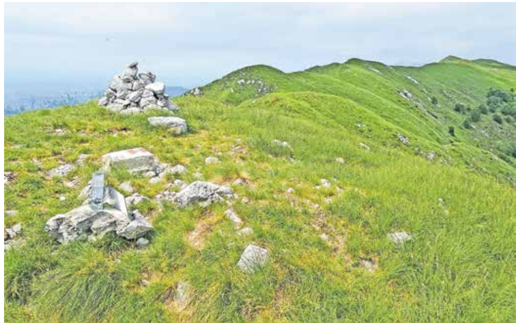
Vrh Breškega Jalovca, s katerega se pokaže dobršen del 34 kilometrov dolgega Stolovega grebena.

Z vrha nadaljujemo naprej proti zahodu, po grebenu, z rahlimi vzponi in