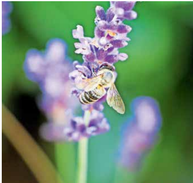
Slabe vremenske razmere so lani zmanjšale medenje medovitih rastlin. Slika je simbolična.

Vlada se je odločila, da čebelarjem pomaga, in je na nedavni seji sprejela odlok, na podlagi katerega bo za izplačilo škode zagotovila iz proračuna do 190 tisoč evrov. Čebelarji, ki so