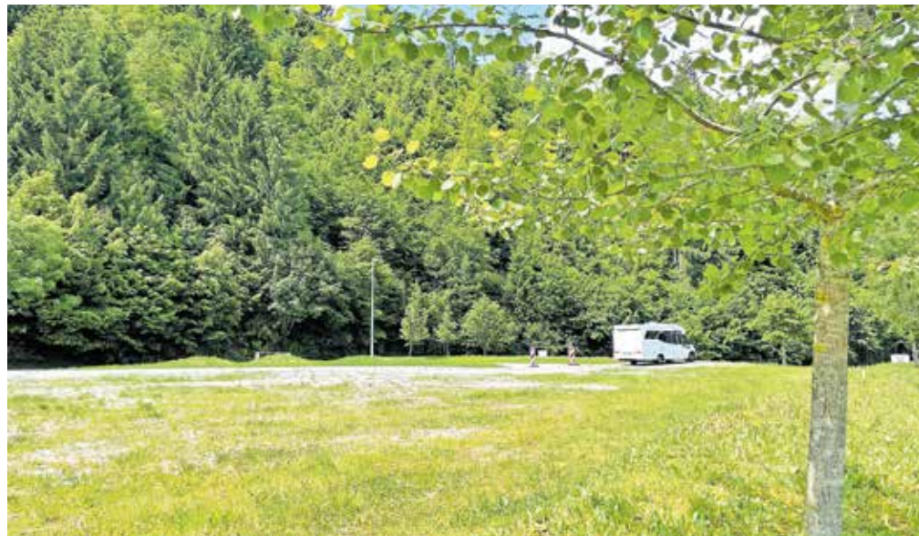
Parkiranje na Pustotniku ne bo več brezplačno. Kot je napovedal župan, naj bi parkomat postavili v enem mesecu.