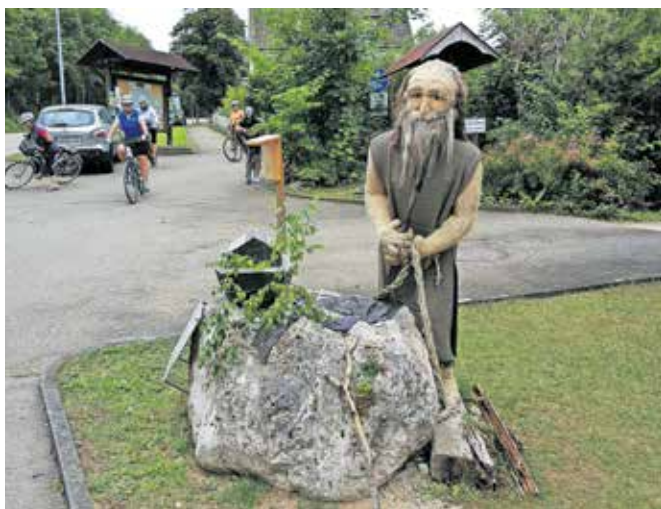
Beuron – domovanje menihov

pravokotnimi ulicami. Nato smo prispeli v romantično mesto Mühlheim na Donavi, kjer je skozi vse leto dovolj vode za poganjanje mlinjskih koles. Naslednje mesto Fridingen ima srednjeveško jedro z lepimi lesenimi hišami in zelo dobro ohranjen grad Ifflinger.