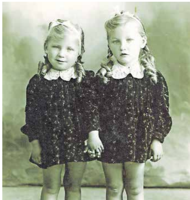
Ko sva bili še čisto majhni