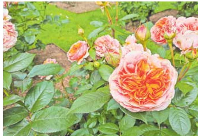
Vrtnice lahko srečamo tudi v kulinariki

makrone, princeske s svežimi jagodami in vrtnično kremo ter mini čokoladne mafine z vrtničnim džemom. Po videzu so bile vse tri sladice strašno privlačne, tudi okus je bil dober, a najbolj nas je očaral vrtnični makron. Čeprav ni bil pričakovane rdeče ali rožnate barve, je imel res okus po vrtnici – in to dišeči.