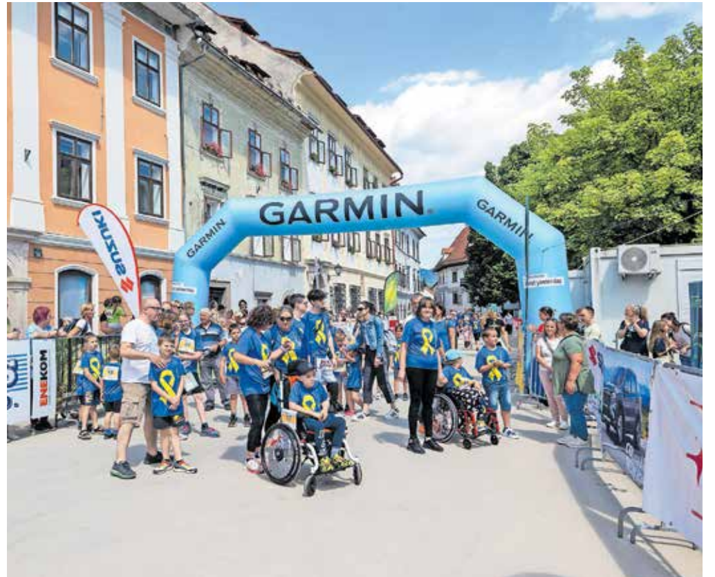
Na četrtem Teku Zlate pentljice se je zbralo rekordno število otrok, udeležence je prišel pozdravit tudi nekdanji predsednik države Borut Pahor.

Udeleženci so se ob 9. uri začeli zbirati v OŠ Škofja Loka-Mesto, kjer stajih pričakala lisjak Foksi in Mini olimpijada, tam so tudi prevzeli startne številke. Malo po 11.