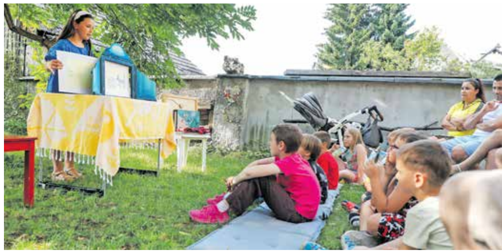
Na dvorišča se vračajo pravljice.

Otroci se bodo po besedah Jadranke Završnik vsak petek srečali s preizkušeni in izkušenimi pripovedovalci, ki bodo s poslušalci znova delili zabavne, resne in poučne zgodbe iz slovenske in svetovne pravljicne zakladnice. V dosedanjih desetih sezonah se je zvrstilo sto nastopov, na katerih je približno 2500 poslušalcev lahko spremljalo okrog