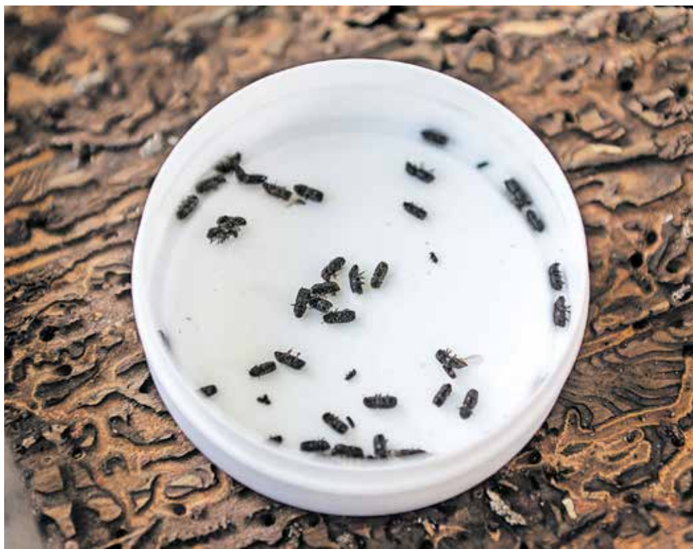
Lubadar je majhen škodljivec, a povzroča lastnikom gozdov veliko gospodarsko škodo.