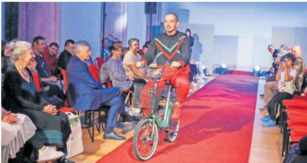
Občinstvo je z zanimanjem čakalo, kaj vse bodo videli na modni brvi. In niso bili razočarani.

mladostniško vzdušje,« je povedala in dodala, da so se v sklopu projekta veliko naučili o trajnostni modi ter negativnem vplivu, ki ga ima tako imenovana hitra moda na svet in družbo.