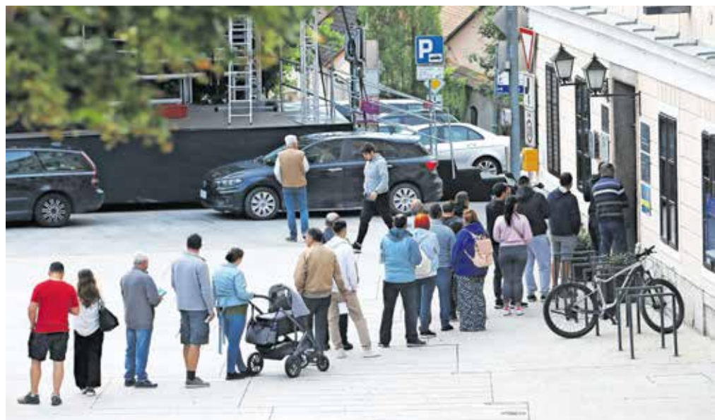
Na Upravni enoti Škofja Loka opozarjajo na dolge vrste in svetujejo, da pridete čim bolj zgodaj, če želite priti na vrsto.

Na Jesenicah, v Trziču, Škofji Loki in Radovljici uslužbenci na upravnih enotah stavkajo le ob sredah. Iz Trziča so sporočili: »Na Upravni enoti Trzič