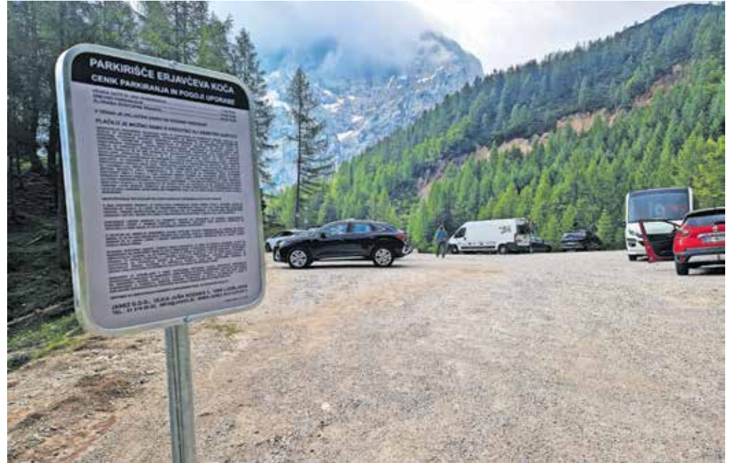
Ena ura parkiranja stane en evro, dnevno parkiranje deset evrov.

»Zaradi stalnih kršitev parkiranja, vožnje in celo parkiranja na dovozni cesti in povsod drugje na travnatih površinah okoli kočice kljub jasno vidnim prometnim znakom ter postavljanja šotorov in avtomobov na travniku pred in pod Erjavčovo kočico smo bili prisiljeni ukrepati. V poletni sezoni je bil dostop do kočice praktično vsak dan onemogočen, tako da v primeru nesreče ne bi imeli dostopa niti