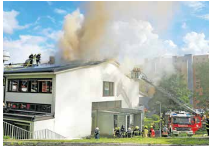
Na ostrejšu osnovne šole je zagorelo 5. junija.

Proračunski denar za sanacijo popožarne obnove šole v Bistrici so prerazporedili s postavk za sončne elektrarne in pa Izobraževalnega športnega središča Križe, s čimer so zamaknili dinamiko izvedbe izgradnje prizidka tamkajšnje šole. Kot pa so pomirili na občinski upravi, bodo glavnino denarja, ki ga bodo dobili od zavarovalnice, že vrnilo za projekt v Križah.