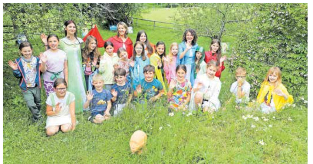
V vilinski deželi v Podljubelju se je zaključila letošnja sezona srečanj projekta Z roko v roki pri ustvarjanju mavričnega sveta.

že od mladih nog, ko sem po prometni nesreči zapadla v kalup težkih misli. V nekem transu sem zagledala vilo, ki živi z menoj in me je poslala na pot vrednot. Otroci mi dajejo neverjeten občutek hvaležnosti. Ko prebiram njihove misli in dobre želje, sem zelo hvaležna. Vibracijski tok hvaležnosti, s katero ustvarjamo boljši svet.« Verjame, da je izobraževanje ključ do sprememb in da lahko že majhni koraki vodijo k velikim spremembam. S svojo neomajno energijo in predanostjo se bo še naprej trudila otrokom pokazati, kako pomembno je, da drug drugemu pomagamo