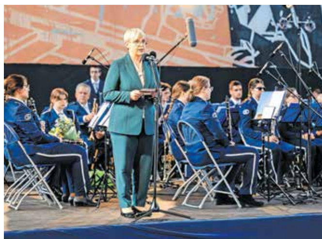
Predsednica republike Nataša Pirc Musar je bila častna pokroviteljica petkovega slavnostnega koncerta ob 150-letnici Pihalnega orkestra Jesenice - Kranjska Gora na Jesenicah.

Jesenice – Slavnostnega koncerta ob praznovanju 150-letnice Pihalnega orkestra Jesenice - Kranjska Gora se je v petek udeležila tudi predsednica republike Nataša Pirc Musar, ki je bila tudi pokroviteljica slovesnosti na Jesenicah. Kot je povedala v slavnostnem nagovoru, so tudi sto petdeset let po začetkih tega orkestra melodije enako žive in vznesene, kot so bile dotlej. »Vsi čutimo, da ste z nami zato, ker imate radi glasbo in ker radi razveseljujete ljudi. In da ste z nami zato, ker imamo tudi