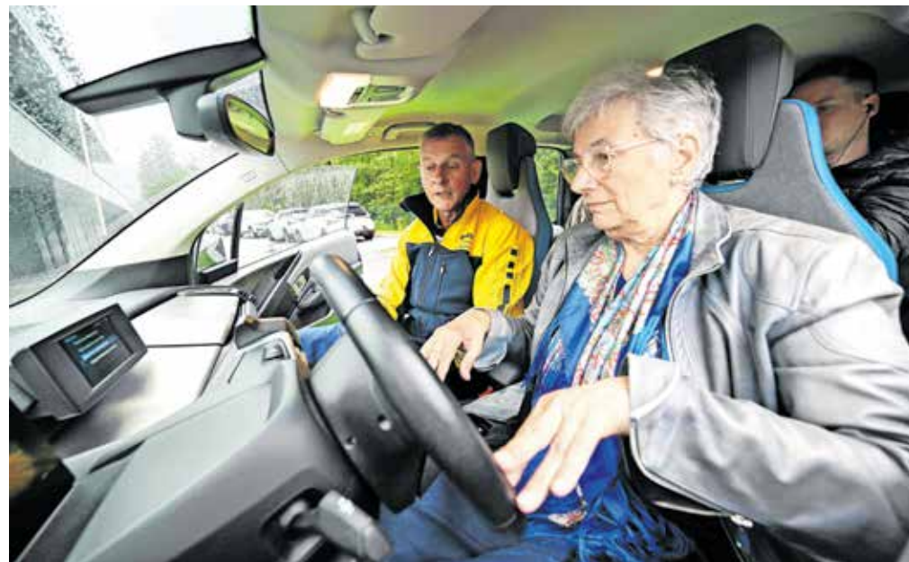
Starejši vozniki z osvežitvenimi vožnjami ohranjajo primerno vozniško kondicijo in s tem možnost samostojne osebne mobilnosti.

le biti namenjene vsem voznikom, ne le starejšim, stroške osvežitvenih voženj pa bi lahko krili iz državnega proračuna ali zdravstvene blagajne, meni Logar. »V preteklosti je bilo pač tako, da se z vozniki od trenutka, ko so pridobili vozniško dovoljenje, ni nihče ukvarjal, vse dokler niso dosegli zakonsko predpisane starosti, ko je treba podaljšati dovoljenje. In vmes je pri marsikom minilo 50, 60 let. V tem času pa je veliko sprememb, tako pri cestnoprometnih predpisih kot infrastrukturi in ne nazadnje vozilih. Zato predlagamo, da bi vozniki opravljali obdobje osvežitvene vožnje, na katerih bi lahko osvežili svoje znanje. Investicija v osvežitvene vožnje bi se po našem mnenju lahko krila iz državnega proračuna ali zdravstvene blagajne, saj se vsak evro, vložen v preventivo,