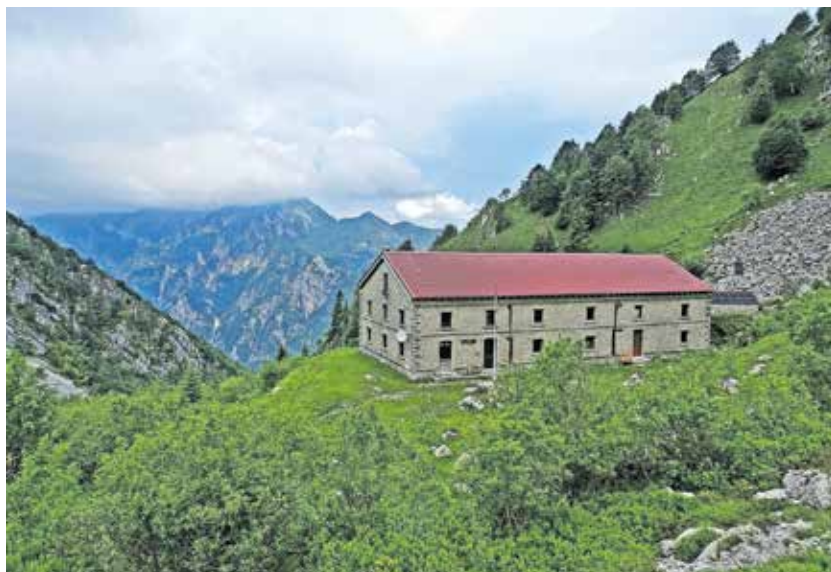
Rifugio A.N.A. Montemaggiore-Monteaperta. Stavba je bila nekoč vojaška bolnišnica.