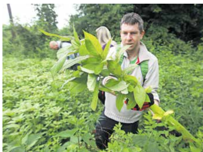
Delovna akcija odstranjevanja invazivk v Kranju poteka že tretje leto.

V Kranju je odstranjevanje invazivk potekalo na štirih lokacijah, med drugim