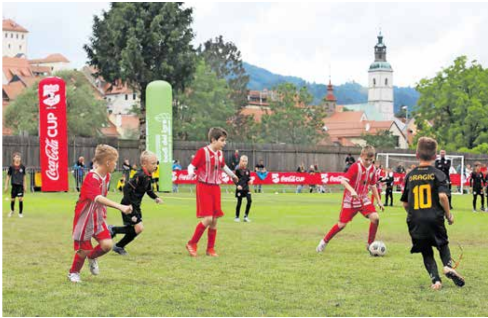
Turnir je letos potekal že v deseti ponovitvi, najmlajši pa vedno pokažejo veliko veselja do nogometa.

»Na pobudo staršev ene izmed selekcij smo prvi Turnir Jan Oblak pripravili leta 2013. V času korone je dvakrat odpadel, tako da letos poteka v deseti izvedbi. Najprej je turnir potekal en dan, igrali sta dve selekciji, prišlo pa je 23 ekip. Že naslednje leto pa je bilo na turnirju osemdeset ekip in smo ga morali podaljšati na dva dni. Nato je bilo ekip vedno več in turnir smo podaljšali na tri dni. Letos je prijavljenih okoli 190 ekip, kar pomeni več kot dva tisoč mladih nogometašev. Zdi se mi prav, da se vse ekipe po skupinskem delu tekmovanja uvrstijo v nadaljevanje, saj tako otroci sproščeno, brez rezultatskega pritiska, igrajo vsaj nekaj tekem. Mislimo, da je v teh časih na otroke že tako preveč pritiska z različnih