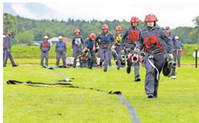
Na stadionu pri kranjski vojašnici se je na mednarodnem gasilskem tekmovanju pomerilo 26 ekip.

me. Med drugim so morali zaradi močnega deževja v petek popoldne odpovedati enega od vrhuncev Bogatajevih dnevov – skupni dinamični prikaz reševalnih aktivnosti enot in sil zaščite in reševanja, ki so se minuli teden zbrale v gorenjski prestolnici. Večino preostalih načrtovanih dogodkov so organizatorji izpeljali – od strokovnih posvetov, lutkovnih predstav za otroke do predaje intervencijskih vozil Gorski reševalni