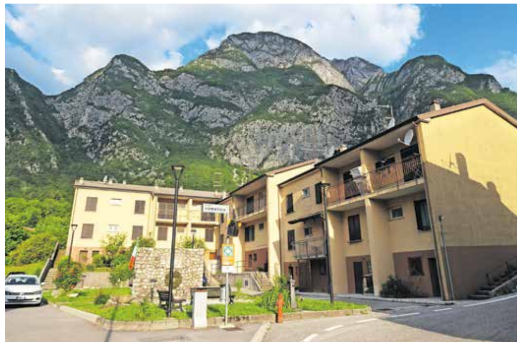
Takole je gora videti z izhodišča. Vrh se ne vidi.

skupini več, da ne prožimo kamenja. Strm vzpon nas pripelje do uživaške planinske poti, ki poteka skozi gabrov in bukov gozd. Stezica se lepo dviga, mestoma pripelje povsem na rob in ponudi razglede za dušo. Pot pravzaprav poteka prečno, a se ves čas dviguje. Gledamo na korak, saj je mestoma precej ozka. Na dveh, treh koncih si malce pomagamo z rokami, a ni pretirane sile. Pot se vztrajno vzpenja. Ko dosežemo grapo potoka Fraris, se po njem med številnimi ogromnimi skalami povzpemo, nato pa pot zavija bolj v desno in grapo zapusti. Pot počasi izgubi strmst in skozi gozd brez večjega naklona