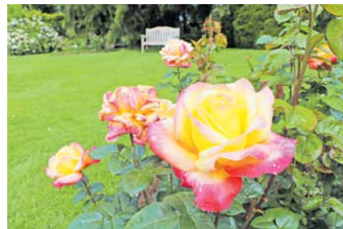
Junija v Arboretumu Volčji Potok blestijo vrtnice in prav zato jim poklanjajo cel mesec. Pripravljajo obilico vrtničnih doživetij s številnimi dogodki in bogato vrtnično ponudbo.

trgovina in galerija. Prenova se bo financirala v okviru Načrta za okrevanje in odpornost, razvojnega področja Zeleni prehod, komponente 2: Trajnostna prenova stavb (C1 K2). Naložba vključuje toplotno izolacijo stavb, energetsko učinkovito stavbno pohištvo, sistem ogrevanja, hlajenja in prezračevanja, energetsko učinkovito razsvetljavo in nadzorne sisteme. Investicija je ocenjena na 961.477 evrov (z DDV), dela naj bi stekla predvidoma letos jeseni, predvideni čas za dokončanje je 14 mesecev po začetku del.