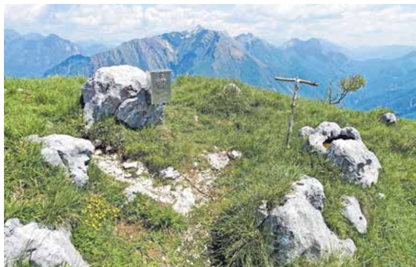
Vrh San Simeone, zadaj je Lopič

Nadmorska višina: 1505 m Višinska razlika: 1300 m Trajanje: 7 ur Zahtevnost: ★★★★★