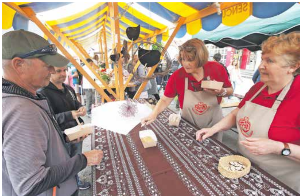
Obiskovalcem je šel najbolj v slast pražen krompir.

Opoldne je nastopil Pihalni orkester občine Šenčur ter mažoretke iz Društva mažoretk Šenčur. Sledilo je branje dekreta, za kar so znova poskrbeli v Folklorem društvu Šenčur. Obiskovalci so nato na osmih