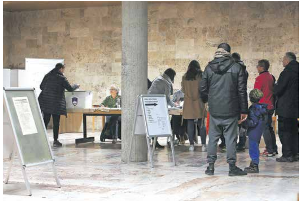
Na Gorenjskem je odprtih štirinajst posebnih volišč za predčasno glasovanje na evropskih volitvah in posvetovalnih referendumih.

Volivci, ki bodo v nedeljo zunaj okraja svojega bivališča in želijo glasovati v drugem okraju na t. i. omnia volišču, morajo to do jutri,