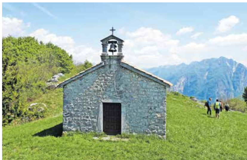
Cerkev sv. Simeona, ki datira v 14. stoletje, točneje v leto 1330