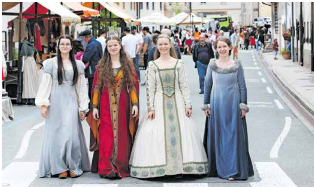
V Škofji Loki so se v soboto znova vrnili za nekaj stoletij v preteklost.

in uš, pa je bilo mogoče spoznati bogato škofjeloško cehovsko dediščino. Kot so poudarili, je bila namreč na Lontrgu skoraj v vsaki hiši kakšna obrt, od čevljarjev do klobučarjev, usnjarjev, žeb-ljarjev ... Od leta 1475 je v Škofji Loki deloval kovaški ceh, od leta 1633 tudi klobučarski, leta 1459 sta bila ustanovljena čevljarjski in krznarski ceh ter leta 1768 še samostojni usnjarjski ceh. V zgodbi Čevlji, klobuk in uš je