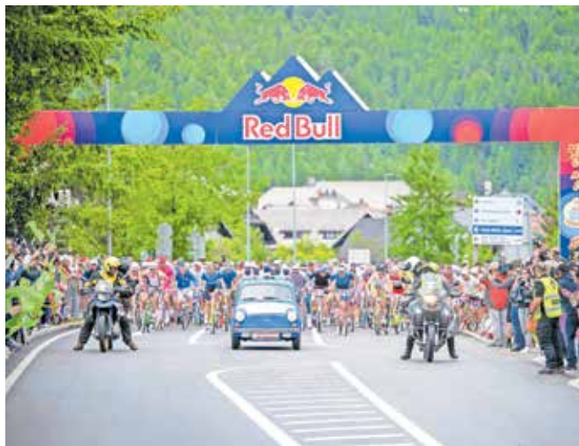
Na startu v spremstvu legendarnega fička