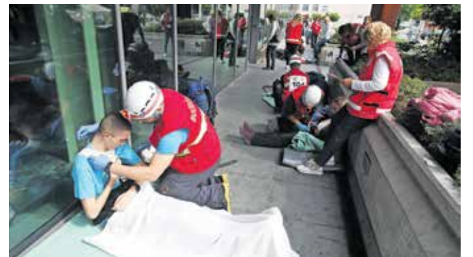
V soboto so izvedli tudi regijsko preverjanje usposobljenosti ekip prve pomoči Rdečega križa in Civilne zaščite.

povabilo, vsakič smo hvaležni, da smo lahko del prireditve in se poklonimo ter izkažemo spoštovanje vsem reševalcem. Naša družina je očeta in moža delila z vsemi vami, s tem sem odraščala, zato mi je zelo blizu in pomembno, da se te vrednote