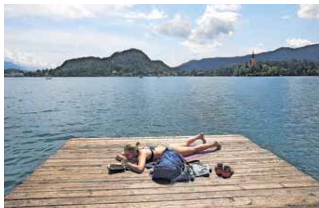
Tudi letos se lahko brez skrbi kopamo na priljubljenih gorenjskih kopalniščih. Kakovost kopalnih voda je namreč odlična.

V Sloveniji je od 47 preverjenih kopalnih voda 37 ocenjenih kot odličnih, osem kot dobrih, ena kot zadostna, ena pa ni bila klasificirana zaradi pomanjkanja podatkov. Slovenija je ena od evropskih držav, kjer so vse kopalne vode dosegle ustrezno kakovost. Države z večjim deležem morskih