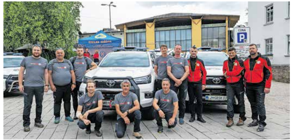
Novih terenskih vozil so se razveselili v gorskih reševalnih službah Bohinj, Jezersko, Kamnik, Koroške, Maribor in Rateče.

zvezi Slovenije, regijskega preverjanja usposobljenosti ekip prve pomoči in mednarodnega gasilskega tekmovanja. Cilj Bogatajevih dnevov je bil s tem dosežen, saj je sistem zaščite in reševanja spoznal širok krog ljudi, je poudaril Šestan.