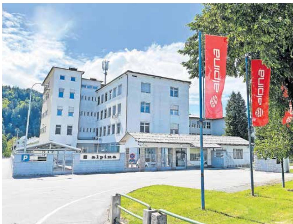
V Alpini bo do konca leta brez dela ostalo šestdeset zaposlenih.