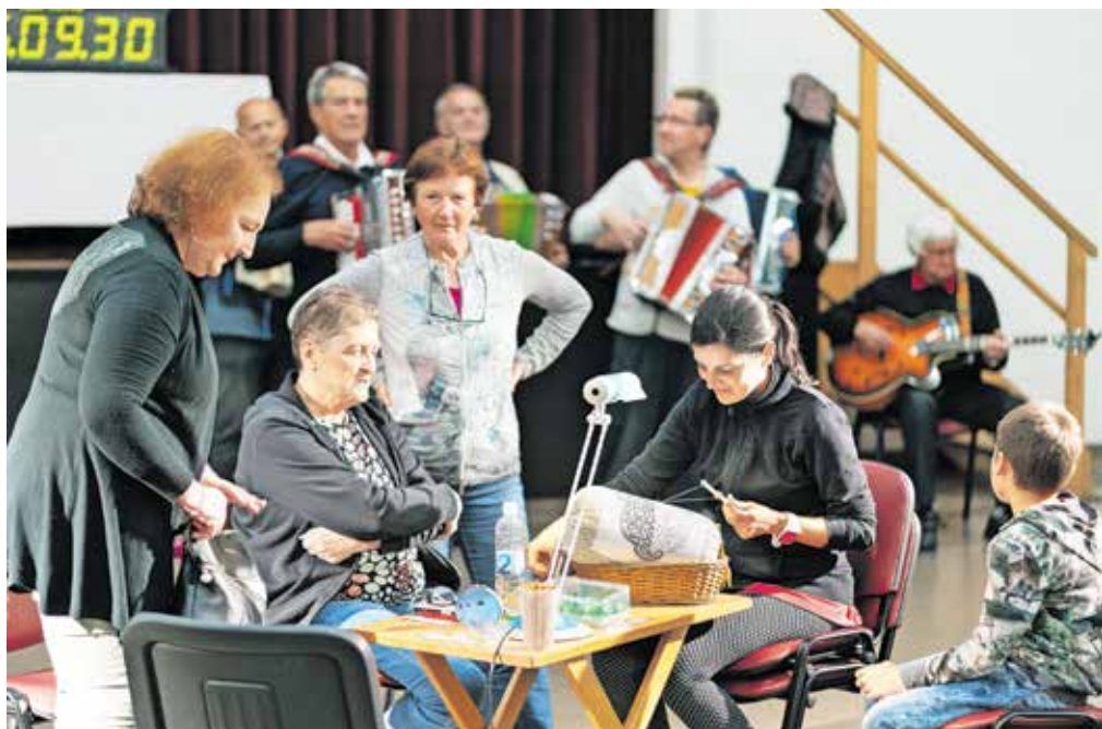
Najbolj živahno je bilo v petek zvečer, ko so klekljarice prišli podpret tudi lokalni glasbeniki.

polnoči, dejstvo pa je, da bi bil obisk celotne prireditve lahko precej boljši. Z obiskom takšnih dogodkov izkažemo tudi spoštovanje do bogate kulturne dediščine. Kljub vsemu smo zadovoljni, da smo prireditve spravili pod streho. Prihodnje leto bo že deseta ponovitev,« je napovedal Weiffenbach.