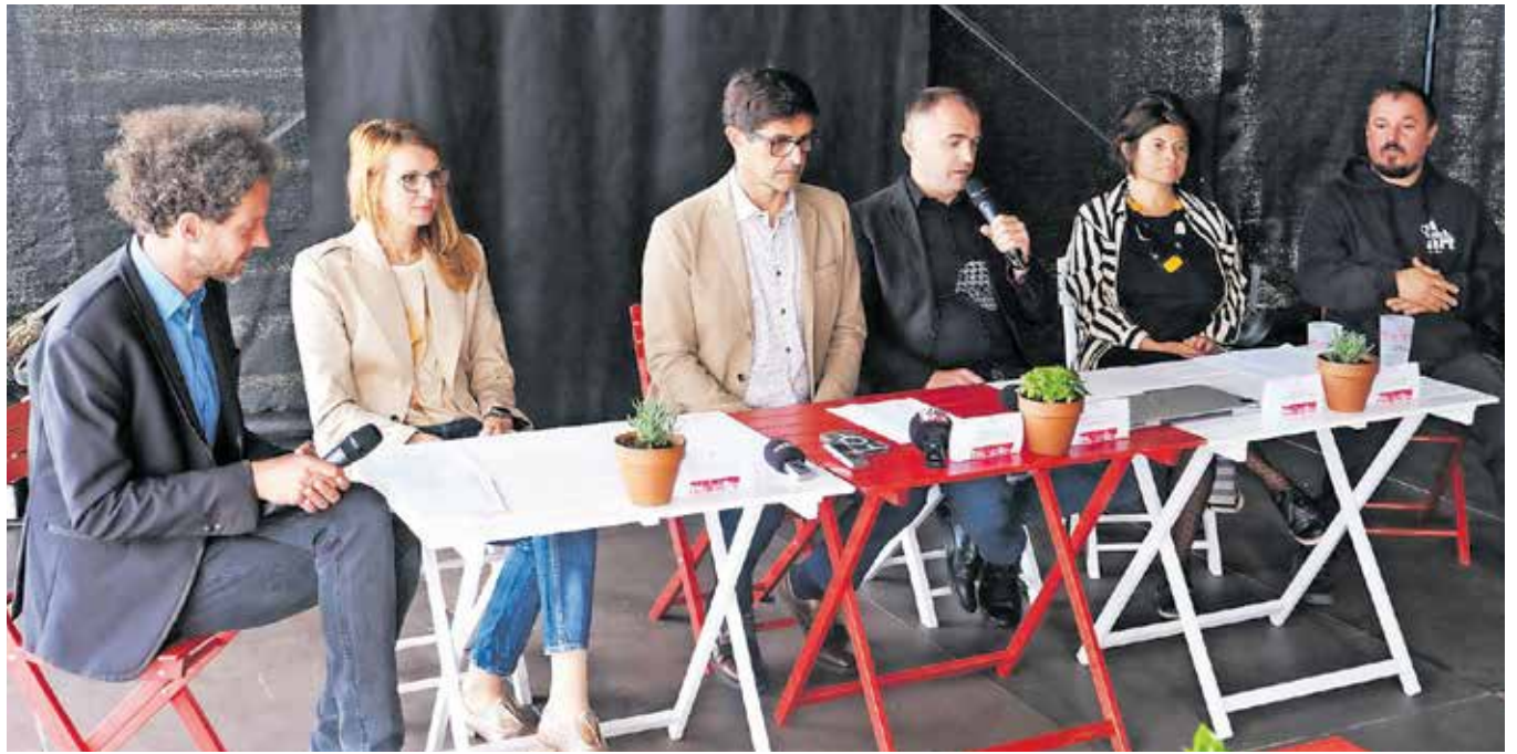
Program Prešernega poletja so predstavili na nedavni novinarski konferenci.

Poletje v Kranju bodo popestrili dogodki v gostinskih lokalih Kavka bar, KluBar Gastropub in Cafe galerija Pungert. Poseben utrip bodo znova dali različni kulturno-umetniški festivali. Minuli konec tedna se je že začel 5. festival sodobnega kolaža KAOS, ki bo na ogled do 10. avgusta. Od 15. do 22. junija bo potekal Kranjski igralski