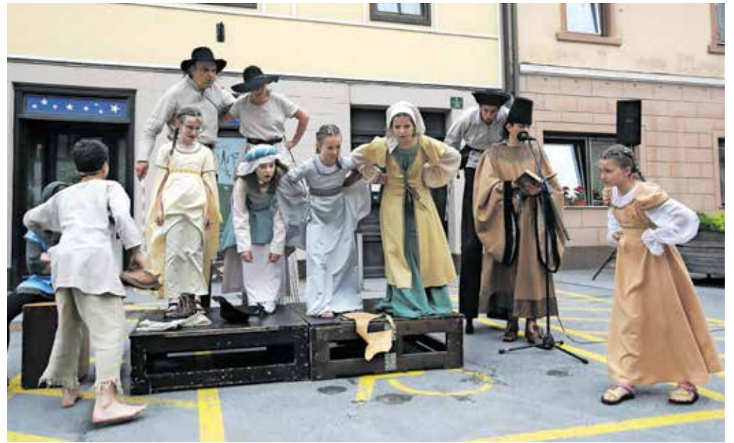
Cehovsko dediščino so predstavili tudi skozi zgodbo Čevlji, klobuk in uš.

italijanske Medičine. Okušati je bilo mogoče loško kulinariko ter se udeležiti strokovnih predstavitev Šeširja, Galerije Franceta Miheliča, Špitalske cerkve in Žeb-ljarjeve hiše. Otroci so lahko ustvarjali na slikarskih in drugih ustvarjalnih delavnicah, na vrtu Občine Škofja Loka prisluhnili pravljicam ali se podali na voden ogled po poteh miške Rubi. V okviru osrednjega dogodka, dramske ulične uprizoritve z naslovom Čevlji, klobuk