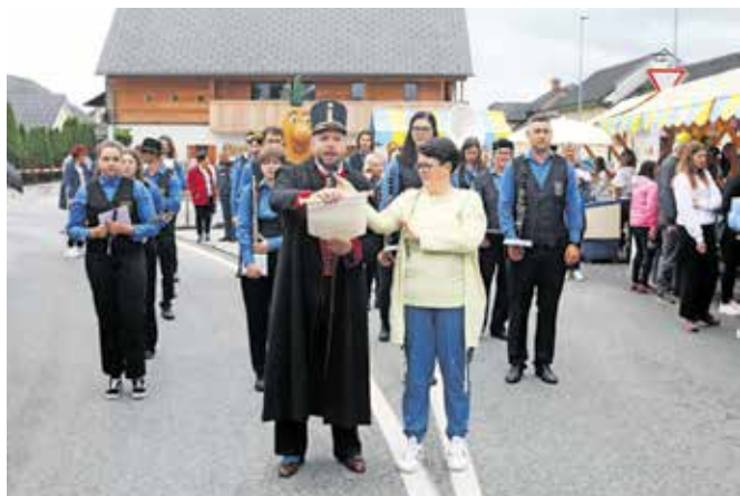
Na Prazniku krompirja vselej preberejo dekret, kar naznanja začetek praznovanja.

Tilen Gubanc z Jesenic pa je v šali dejal, da bi brez krompirja težko preživel. »Rad ga imam na vse načine. Jem ga petkrat na teden, najpogosteje ravno praženega. Podaj se k vsem jedem in ima širok spekter uporabe.«