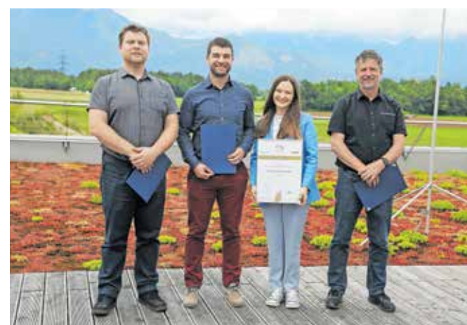
Priznanje za izziv s področja trajnosti je prejelo podjetje Iskraemeco.