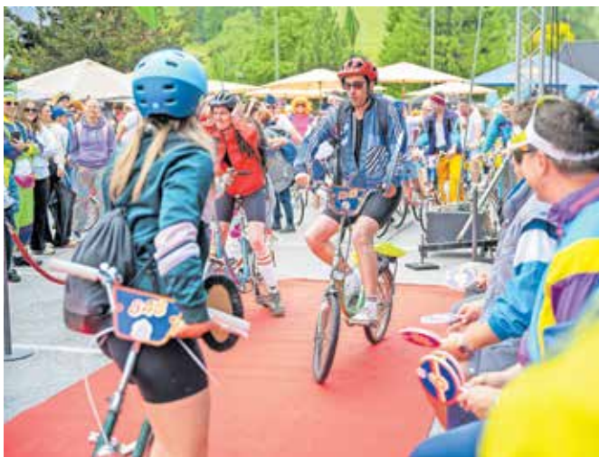
Ocenjevanje retro oprave kolesarjev

Tekmovalje, pa naj bo cilj zmagaja, osebni rekord ali morda le priti do cilja, ima poleg športne tudi zabavno noto. Zaželeno so retro oblačila, med katerimi je žirija tudi letos izbrala najboljšo.