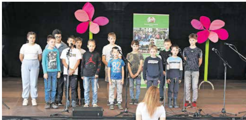
Za uvod v Frankofonski festival so učenci OŠ Orehek zapeli himno festivala, to je Kekčevo pesem v francoščini.

Festival so v OŠ Orehek tudi letos pripravili v sodelovanju s Slovenskim društvom učiteljev francoščine, Mestno občino Kranj, Francoskim inštitutom v Sloveniji, zavodom za šolstvo, ministrstvom za izobraževanje, znanost in šport ter Zavodom za turizem in kulturo