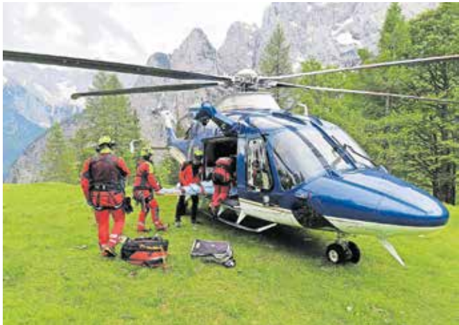
Policijski helikopter je sodeloval v treh reševanjih.

Klic na pomoč so gorski reševalci v nedeljo prejeli tudi iz okolice koč na Doliču, kjer so štirje prav tako neustrezno opremljeni tuji pohodniki obtičali zaradi nevihte in snega, ki sta jim onemogočila varen sestop. Vse štiri so s policijskim helikopterjem prepe-