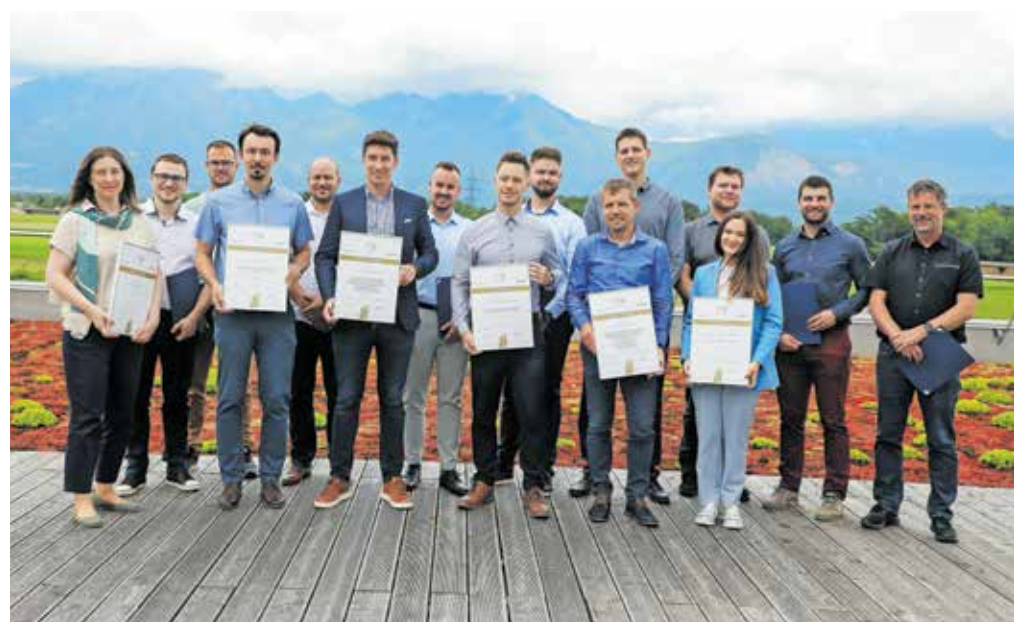
Nagrajeni z zlatimi priznanji