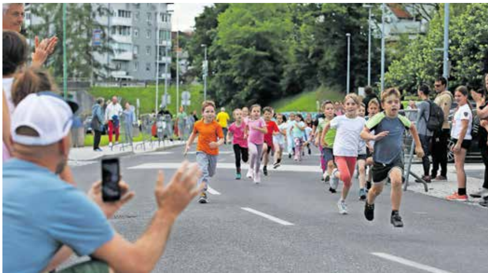
V sobotnem popoldnevu so po Medvodah tekli otroci.

Zadovoljstvo vzbuja tudi izvedba sobotnega programa z nočnim tekom, ki je tokrat – organizirali so ga sedmič – privabil rekordnih 380 tekačev. Na desetkilometerski razdalji sta bila