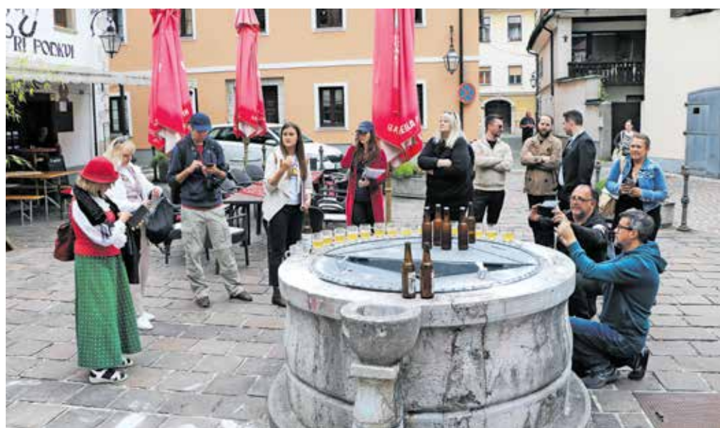
Pot piva in svobode sicer ne vključuje umetnostnega vidika, a ni zato nič manj zanimiva. Prepletena je s spoznavanjem Kamnika, kamniških pivovarjev in zgodovine piva v mestu, obiskovalci pa izvedo tudi, od kod ime doživetja. Vsak za degustacije dobi tudi pivski kozarec, ki ga po koncu poti lahko obdrži.

V dobri uri in pol smo se sprehodili skozi izjemno mednarodno razstavo sodobnih umetniških