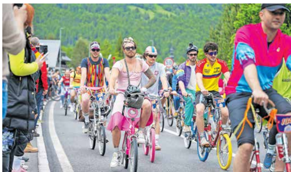
Letos je bila rekordna udeležba